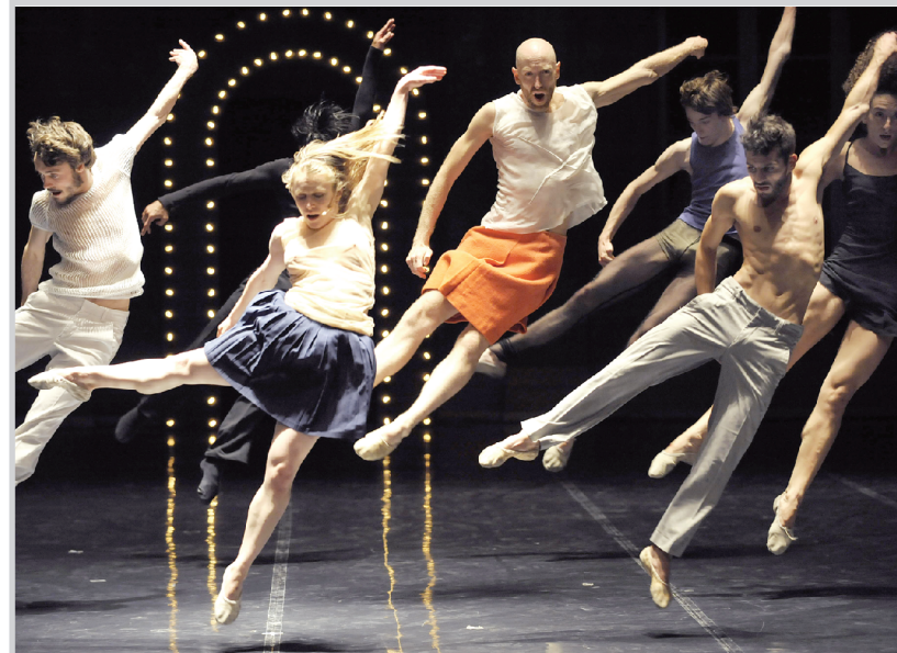
راقصون فرنسيون لشركة ايمو كريكوا الإعلالية يؤدون رقصة جيمم الباليه