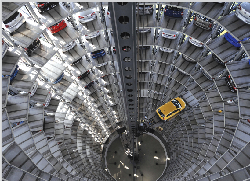
موديلا لسيارة الفولكس واجن في مرآب السيارات القريب من الشركة