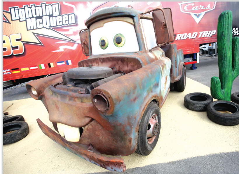
لعبة لسيارة من فيلم (السيارات) الذي عرض في يوم الصحافة بلندن