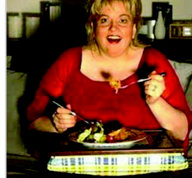
عن مجلة لوبوا الفرنسية

ان هذا الامر يعد مشكلة عامة لانقتصرت فقط على العمل بل من الناحية العاطفية ايضا فقد انقلبت المفاهيم عما كانت عليه قبل قرن من الزمان عندما كانت المرأة الممتلئة هي الاوفر حظا في الحصول على زوج فيفضل الزخم الاعلامي الذي يعمل