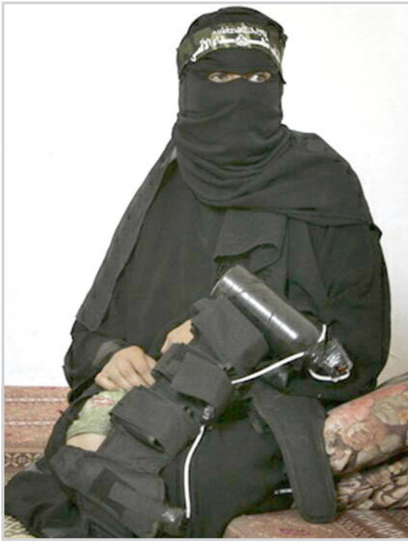
عنا النيويورك تايمز

توجهة / عمار كاظم محمد نفذت اربع نساء عراقيات عمليات انتحارية هذا الاسبوع مما يرفع العدد الى ٢٧ عملية انتحارية قامت بها نساء ارهابيات هذا العام واي شخص يقرأ الصحف او يراقب التلفاز يرى مقدار الاضطراب في تبليان اراء الناس حول الاساس الذي تنطلق منه العمليات الانتحارية النسائية . لقد اخبرنا ان النسوة يصبحن انتحاريات بسبب اليأس او الاضطرابات العقلية او تبعيتها الدينية للرجال حيث يصبن بالايجاب نتيجة عدم المساواة الجنسية وعوامل كثيرة اخرى تتعلق بشكل محدد بالنظرة الى جنس المرأة في المجتمع. وفي الحقيقة ان الشيء الوحيد الذي يمكن ان نتفق عليه هو شيء اساسي يكمن في اختلاف الحوافز بين الرجال والنساء في عملية اقناعهم في ان يكونوا مهاجمين انتحاريين؛ والمشكلة الوحيدة هي ان هناك القليل من الادلة على معرفة طبيعة تلك