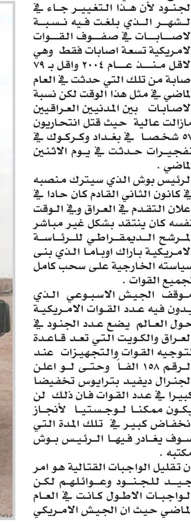
عنا النيويورك تايمز