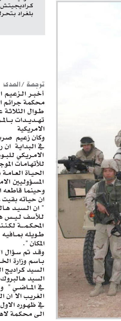
عنا النيويورك تايمز