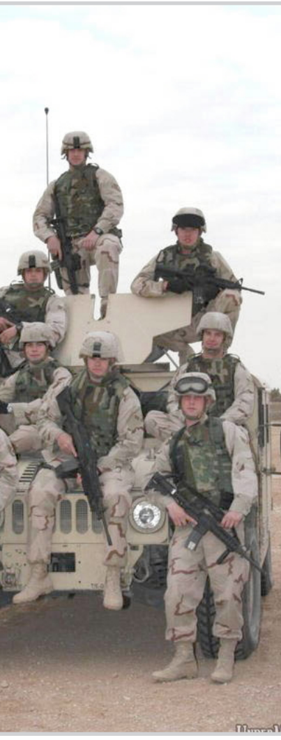
عنا النيويورك تايمز