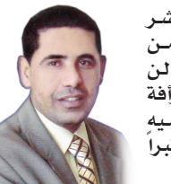
مهما فعل الجلاد، وقال، ونشر أكاذيبه، ومهما وجد من مساندين، ومنفتحين، فإنه لن يجد من العدالة السماوية، رافة بل تلاحقه، وتمسك به وترميه لعل غياهب السجون، ولعل معتبرا يعتبر، لتقف عجلة المجرمين.

ومهما فعل الجلاد، وقال، ونشر أكاذيبه، ومهما وجد من مساندين، ومنفتحين، فإنه لن يجد من العدالة السماوية، رافة بل تلاحقه، وتمسك به وترميه لعل غياهب السجون، ولعل معتبرا يعتبر، لتقف عجلة المجرمين.