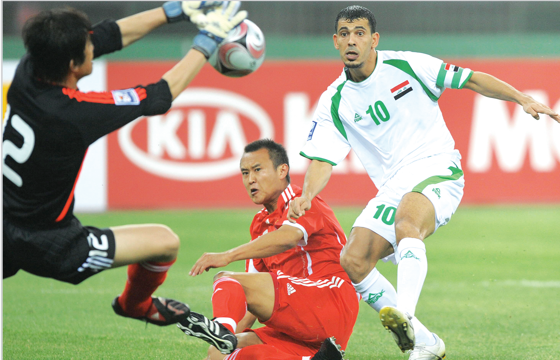
جانب من لقاء منتخبنا الوطني مع نظيره الصيني في تصفيات كأس العالم ٢٠١٠