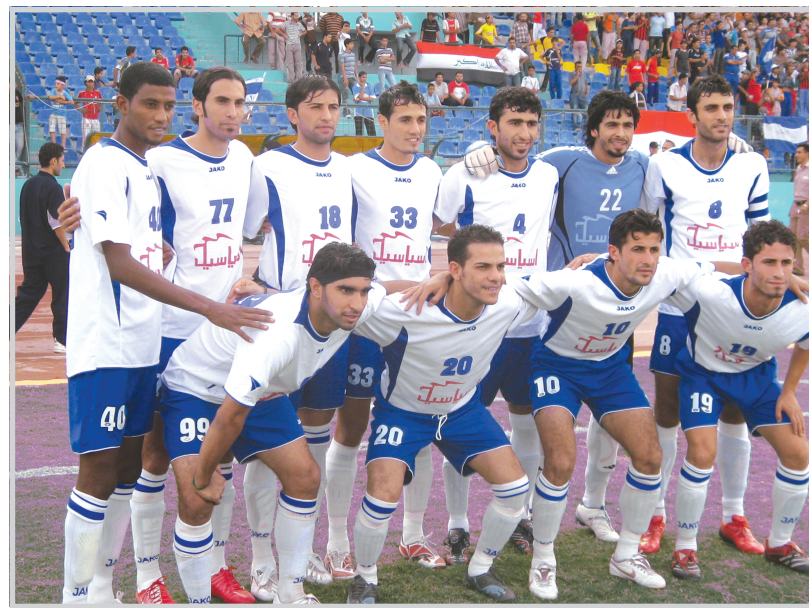
دهوك اعلى فرق مجموعته الثانية باستحقاق

دهوك / عماد البكري تصدر فريق نادي دهوك فرق مجموعته الثانية بعد اجتيازه اخر عقبة في طريقه فريق نادي نبط الجنوب بهدف وحيد كان كافياً لخطف نقاط المباراة التي جرت على ملعبه وقادها طاقم تحكيم مؤلف من فلاح عيد وجليل صبيحي وعدنان عزم وزكاز محمد. واستفاد دهوك من فوزه وتعثر منافسه اللدود فريق كربلاء امام الطلبة ليصبح رصيده ١٨ نقطة فيما بات لكربلاء ١٦ نقطة فقط لم تمنحه سوى جواز اللعب مع اصحاب المراكز الثانية النجف والجوية للفوز ببطاقة التاهل الوحيدة للمربع الذهبي . وجاء فوز دهوك منسجماً مع واقع حال المباراة التي جرت تفاصيلها وفق