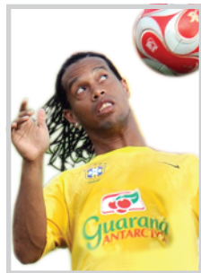
رونالدونيو في طريقه لاستعادة مستواه