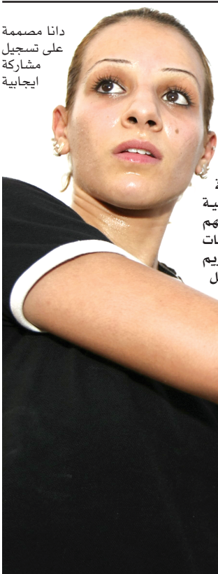
دانا مصممة على تسجيل مشاركة ايجابية