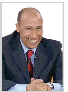
عويطة ينتقد الية صناعة البطل العربي