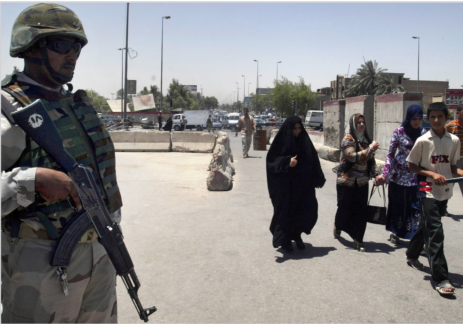
قوات أمنية لحفظ الأمن في شوارع بغداد

وقال هارتلنغ في مؤتمر صحفي عقده في مقر قيادته في العراق ان وزير الدفاع عبد القادر الدليمي زار المدينة بعد ان تلقى تقارير من جهات عراقية ان الوضع في كركوك على وشك الانفجار، لكنه عادها مطمئناً. وأضاف: "محافظة كركوك واحدة من أكثر المحافظات الواقعة ضمن محيط عملنا سلاماً. كذلك هي الحال في