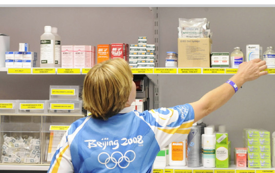
١٥٠٠ فحص تجري للكشف عن المنشطات

بكين / وكالات كشفت اللجنة الأولمبية الدولية انها اجرت ١٥٠٠ فحص للكشف عن المنشطات حتى الآن أي ما يعادل ثلث الفحوصات ال ٤٥٥٠ التي أعلنت انها ستقوم بها طيلة النهائيات. وتابعت اللجنة الأولمبية الدولية انه تم اكتشاف حالة ايجابية واحدة حتى الآن وتنتقل بالدرجاة الاسبانية ماريبييل مورينو التي أثبتت