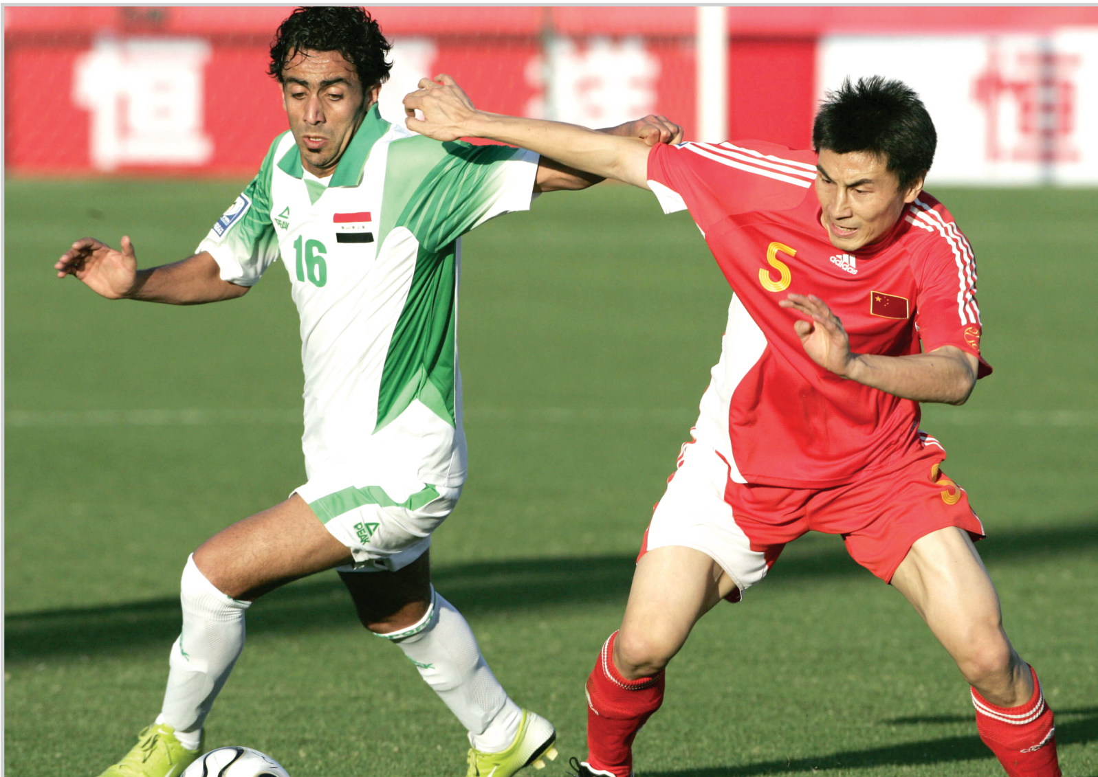
الكرة العراقية تترقب المدرب الاجنبي الموعد!