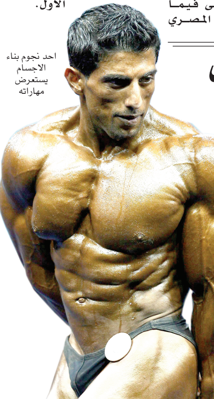
احد نجوم بناء الاجسام يستعرض مهاراته