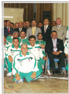
الجوار الصبية تودم وفدها الى ماليزيا