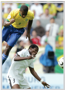
اليوم.. مباريات تاريخية للبرازيل والارجنتين