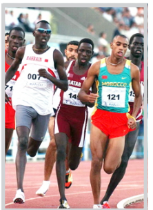
سباق الثلاثي الناري (عشر المليون)