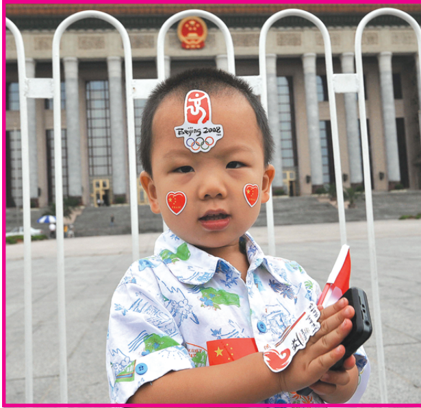
طفل صيني يصنع وجهه بشعارات الألعاب الأولمبية الحالية القائمة في بكين