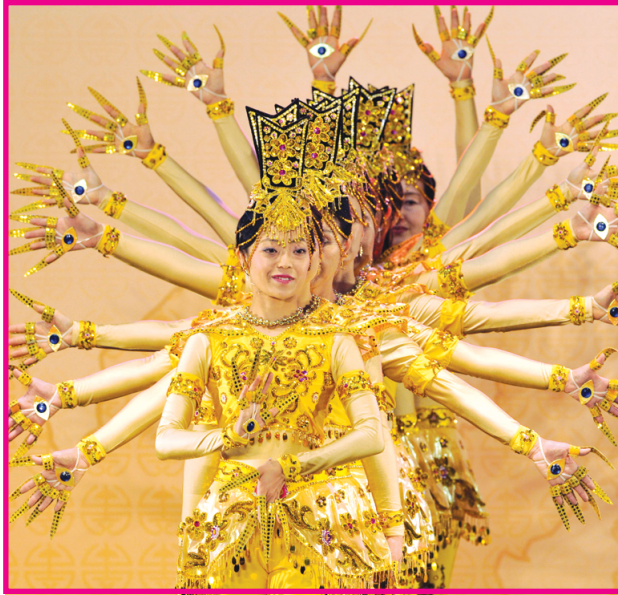
مجموعة من الرقصات الصينيات يؤدون رقصة الأيدي في أحد المجمعات الترفيهية