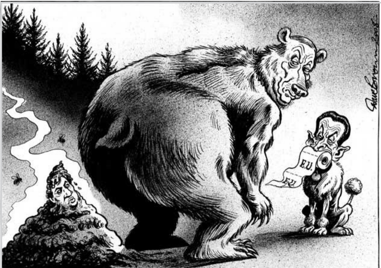
عن صحيفة الاندبنتد البريطانية

القدس / الوكالات قال مسؤولون امس الاثنين ان وزيرة الخارجية الامريكية كوندوليزا رايس ستزور الشرق الاوسط الاسبوع القادم في محاولة جديدة لتحقيب تقدم باتجاه التوصل لاتفاق سلام فلسطيني اسرائيلي. كانت الولايات المتحدة قد عبرت عن أملها في التوصل لاتفاق اطار للسلام بين اسرائيل والفلسطينيين قبل انتهاء ولاية رئيسها جورج بوش في كانون الثاني. لكن المحادثات تعثرت بسبب الخلافات بشأن بناء المستوطنات الاسرائيلية ومستقبل القدس. وقال المفاوض الفلسطيني صائب عريقات ان رايس ستزور المنطقة في ٢٥ و ٢٦ آ ب وستعقد سلسلة من الاجتماعات الثلاثية والثنائية. وأكد مسؤول وزارة الخارجية الاسرائيلية مواعيد المحادثات التي ستجريها رايس في القدس والطفة الغربية. وفي محاولة معلنة لتعزيز موقف الرئيس الفلسطيني محمود عباس وافقت لجنة بمجلس الوزراء الاسرائيلي يوم الاثنين على قائمة بأسماء ٢٠٠ سجين فلسطيني سيطلق سراحهم في ٢٥ اغسطس. وقالت اللجنة ان اثنين ممن قضا