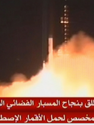
ايران تطلق بنجاح المسبار الفضائي الودع "اميد" المخصص لحمل الأقمار الإصطناعية

إيران لتوسيع انشطتها النووية لن يجر فرض المزيد من العقوبات عليها من الامم المتحدة. وفرضت الامم المتحدة ثلاث مجموعات سابقة من العقوبات على ايران منذ عام ٢٠٠٦ . وتستبعد ايران حتى الآن تجميد أو تعليق تخصيب اليورانيوم وهو امر من شأنه أن يبدأ مفاوضات رسمية بخصوص حزمة الحوافز التي تقدمت بها القوى الست. ويمكن لتخصيب اليورانيوم أن يستخدم في إنتاج الوقود اللازم لمحطات الطاقة أو أن ينتج الوقود اللازم لتصنيع رؤوس نووية اذا جرى تخصيبه بدرجة أعلى. وقالت طهران امس الاول الاحد انها وضعت نموذجا على شكل قمر صناعي في مدار حول الأرض باستخدام صاروخ محلي الصنع للمرة الأولى. والتكنولوجيا المستخدمة تحمل الأقمار الصناعية الى الفضاء يمكن أن تستخدم أيضا في اطلاق أسلحة لكن إيران تقول ان لها مقاصد مدنية فقط. وقالت طهران امس الاول الاحد انها وضعت نموذجا على شكل قمر صناعي في مدار حول الأرض باستخدام صاروخ محلي الصنع ضمن برنامجها للأقمار الصناعية. ووصفت واشطن التي اتهمت إيران بأنها تسعى الى تزويد صواريخ برؤوس نووية اختبار الصاروخ الإيراني بأنه امر