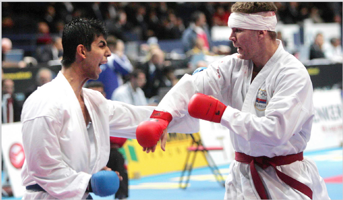
الكاراتيه العراقي حقق نتائج مميزة في البطولات العربية