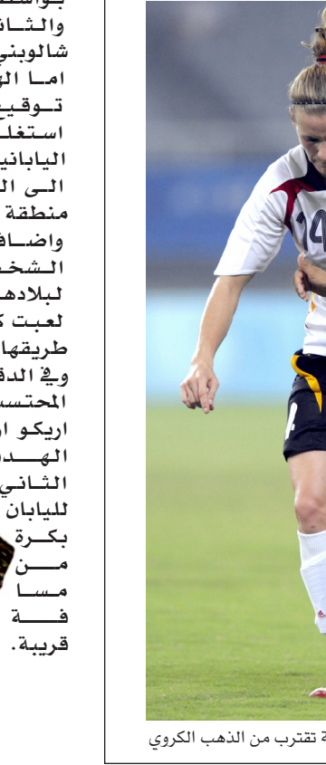
الساميا النسوية تقترب من الذهب الكروي

وكانت البرازيل خسرت امام المانيا صفر-٢ في المباراة النهائية لكأس العالم التي استضافتها الصين العام الماضي. وتلتقي البرازيل في المباراة النهائية مع الولايات المتحدة حاملة ذهبيتي اتلانتا ١٩٩٦ واثينا ٢٠٠٤ التي قبلت تخلفها امام اليابان الى فوز لافت ايضا بنتيجة ٤-٢ في الساعة الرابعة عصرا بوقيت بغداد. وقاجات اليابانيات الجميع بافتتاحهن التسجيل في الدقيقة ١٦ عبر شينوبو اونو. الا ان الرد الاميريكي كان قويا وقيل نهاية الشوط الاول حيث سجلت الاميريكيات هدفين في ظرف ثلاث دقائق الاول