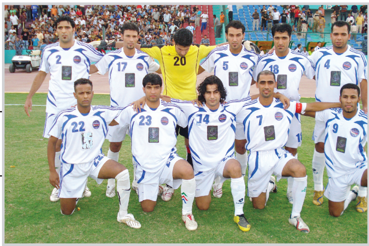
النخبة فقدت امله الاخير بمحط ارادته..