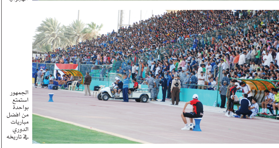
الجمهور استمتع بواحدة من افضل مباريات الدوري في تاريخه