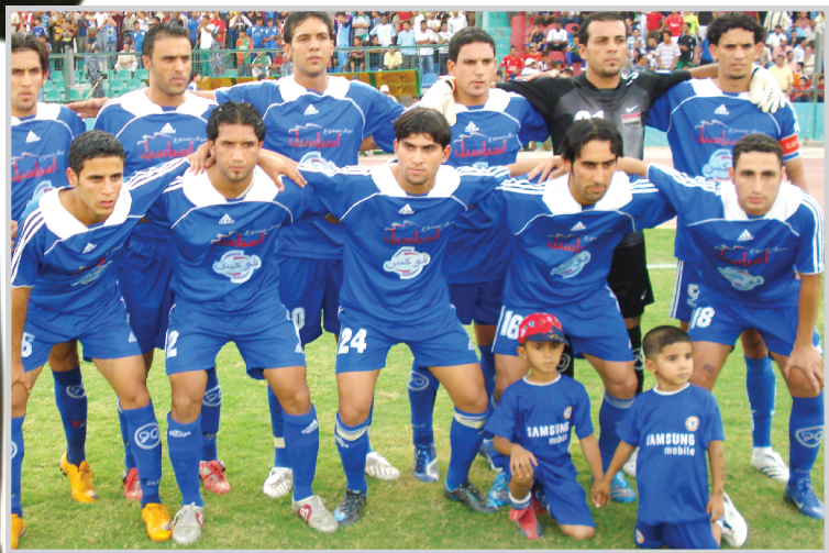
الضمور حلت بابداع وامررت جماهيرها على المدرجات