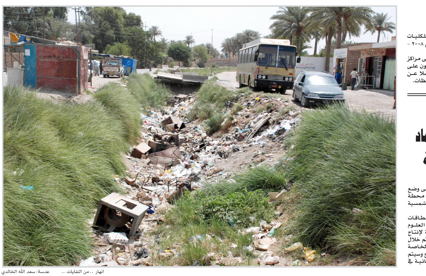
انهار .. من النفايات ..