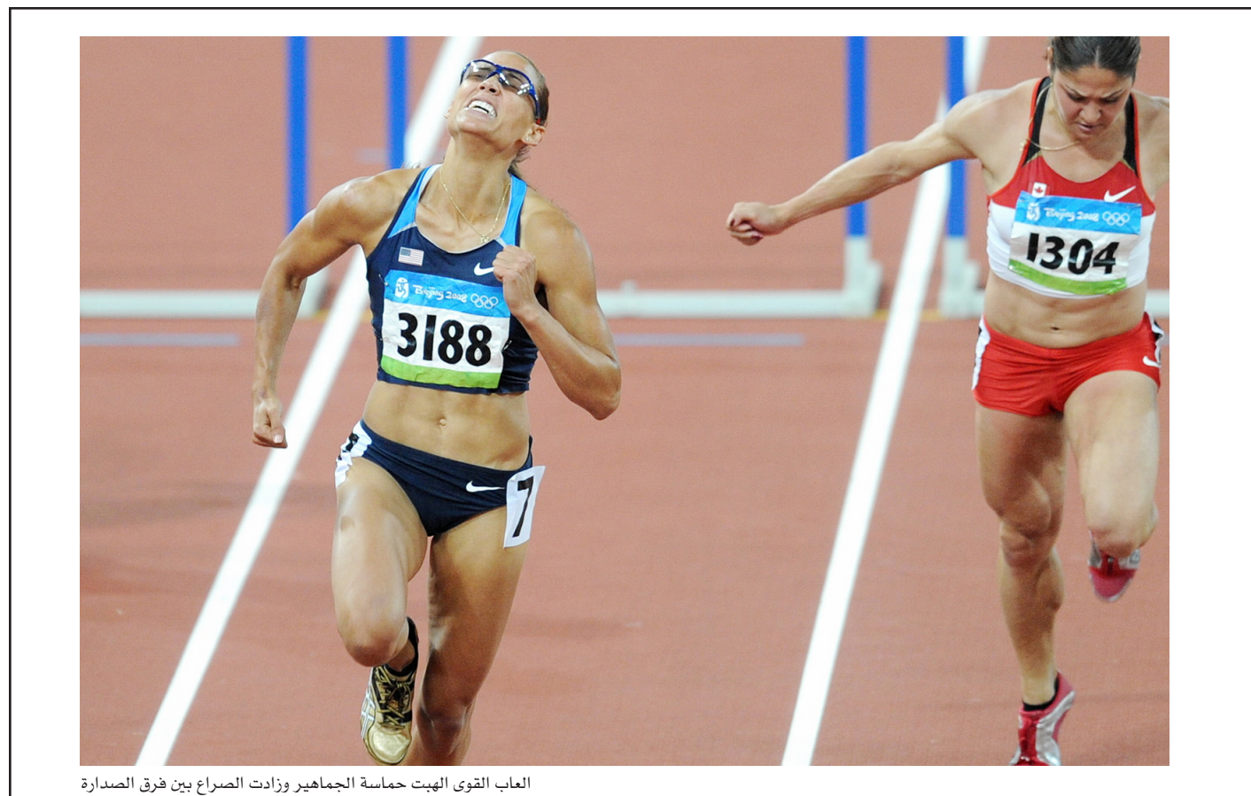
العاب القوى الهبت حماسة الجماهير وزادت الصراع بين فرق الصدارة

كيلومترا مشي للسيدات وذلك وسط ظروف طقس سيئة. وسجلت كانيشكينا بطلة العالم ساعة واحدة و٢٦ دقيقة و٣١ ثانية في السباق الذي انتهى عند ملعب (عش الطائر) والذي أقيم تحت أمطار غزيرة. وأحرزت النرويجية كيرستي بلاترز الميدالية الفضية لتكرر الإنجاز الذي حققته في أولمبياد سيدني عام ٢٠٠٠ وذلك بعدما احتلت المركز الثاني بزمن ساعة و٢٧ دقيقة و١٧ ثانية. وجاءت الإيطالية إليسا رجاودو في المركز الثالث بزمن ساعة و٢٧ دقيقة و١٢ ثانية