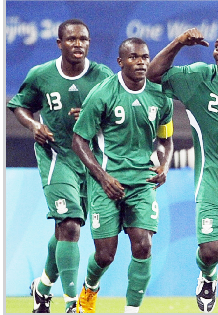
الفرحة النيجيرية هل تكرر اليوم في النهائي

نهائي المونديال الذي أقيم عام ٢٠٠٥ في هولندا حيث سجل ميسي هدفي بلاده من ركلتي جزاء لتفوز على (النسور) ١٢، وختم: "نجمهم الأكبر هو ميسي. هذا كل ما في الأمر". واعتبر سياسيا ان مجموعته يمكنها ان تقلب التوقعات وتنتزع من المنتخب الأرجنتيني الميدالية الذهبية التي أحرزها قبل أربعة أعوام في أثينا بفوزه على الباراغواي ١-صفر في المباراة النهائية: "أثق بلاعبى فريقي وهم يثقون بأنفسهم كما شاهدتم من خلال أدائهم في هذه الدورة حتى الآن، إذ لم تكن التوقعات تشير إلى إمكان بلوغنا هذه المرحلة المتقدمة، بيد أننا وصلنا تطوير مستوانا من مباراة إلى أخرى وأثبتنا ان المشككين بقدراتنا هم على خطأ، من هنا، إذا أراد الأرجنتينيون الفوز علينا عليهم القيام بعمل كبير جدا". من جهته، قال مدرب الأرجنتين سيرجيو باتيستا: "هنا المنتخب الأرجنتيني التزم في كل مباراة خلال الألعاب الأولمبية بهدف الفوز بالميدالية الذهبية"، أما المهاجم سيرجيو اغويرو الذي سجل هدفين في المرمى البرازيلي فقال انه يرى تشابها في فوز