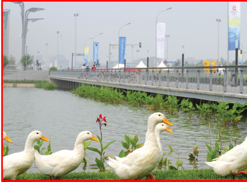
كان لوجود البط اهمية كبيرة في اكمال الصورة الزاهية للعاصمة بكين في اثناء الالومبياد