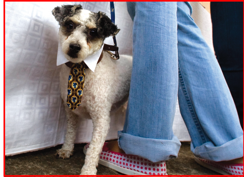
كلب تبنته جمعية ناشطة للكلاب بامرিকা

طريق العظيم طريق الامات قبل يومين سافرت عائلة من بغداد الى السليمانية للابتعاد مؤقتاً عن جو بغداد الحار وركبت العائلة في إحدى سيارات متشاة نقل الركاب التي عادت للعمل . وبعد ان امتأت السيارة التي نقل ستين راكباً انطلقت بهم من مرآب النهضة وفي طريق العظيم الذي كان سابقاً طريقاً للموت مثل اللطيفية تعطلت السيارة وكعادة للركاب في مثل هذه الحالة نزل قسم منهم يدور حول السيارة ويقي القسم الآخر في السيارة واستمر بهم الحال أكثر من ثلاث ساعات حتى جاءت سيارة اخرى بذات المواصفات ونقلتهم الى مدينة السليمانية . وطوال هذه الفترة التي كانت السيارة عاطلة لم يشعر احد منهم بالخوف بفضل استتباب الامن وسيطرة قوات الجيش والشرطة على المكان ويتعاون الناس الموجودين في ذلك المكان .