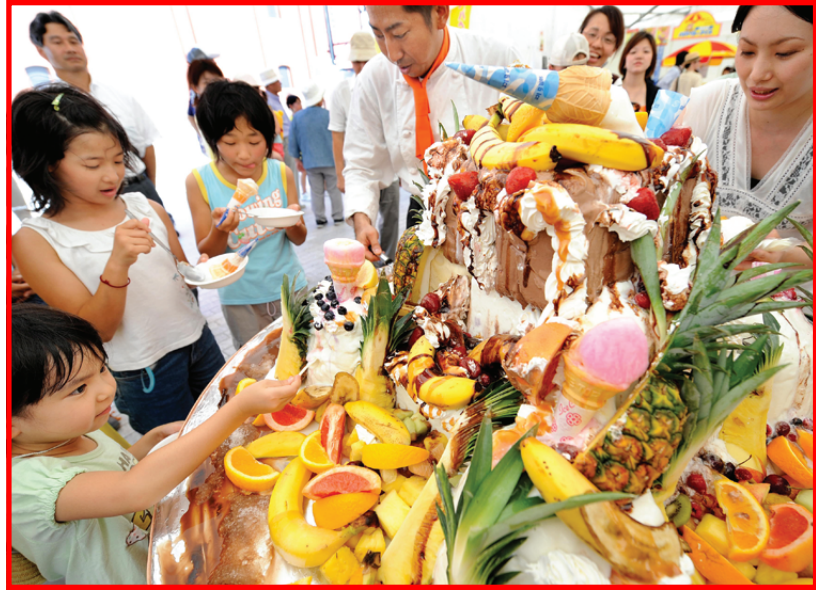
اطفال يابانيون يتذوقون قطعاً من الآيس كريم في مهرجانات الامطعة الصيفي