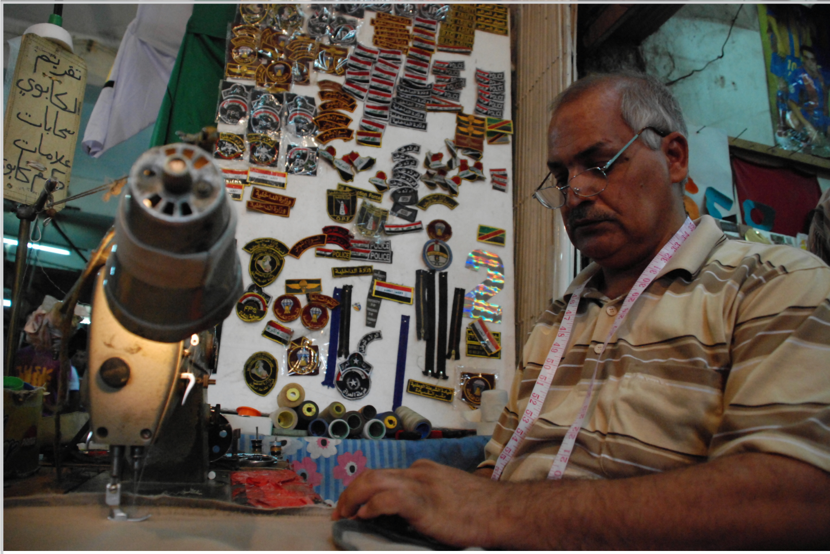
مهنة الخياطة...