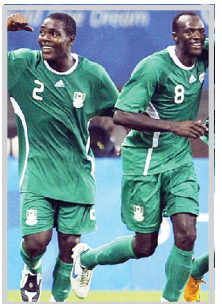
نيجيريا تسعنا لايقاف ميسيا