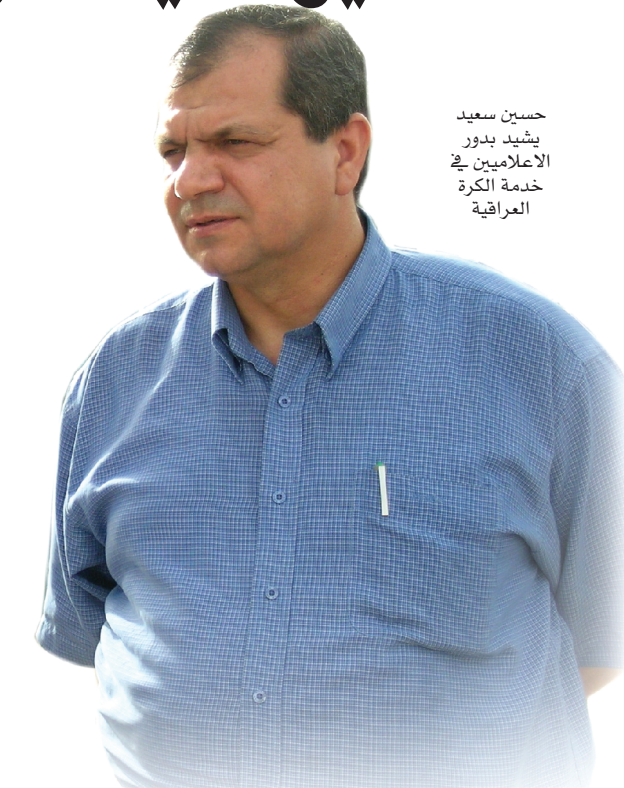
حسين سعيد يشهد بدور الاعلاميين في خدمة الكرة العراقية

بغداد / إيهاد الصالحيا أثنى رئيس الاتحاد العراقي لكرة القدم حسين سعيد على مناشدة (المدى الرياضي) له شخصيا بضرورة الحضور في نهائي دوري النخبة الذي سيجري يوم الرابع والعشرين من الشهر الجاري بين فريقي الزوراء واربيل وانهاء غريبتها التي طالبت اكثر من عامين مبدئيا برغبة كبيرة في العودة الى بغداد ان ظروفها خاصة تشعره بالخطر على حياته تحول دون تنفيذ تلك الرغبة . وقال سعيد في اتصال اجبرته (المدى الرياضي) لبيان الاسباب