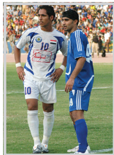
النورس وهولير يدا بيد الحا نهانجا النخبة