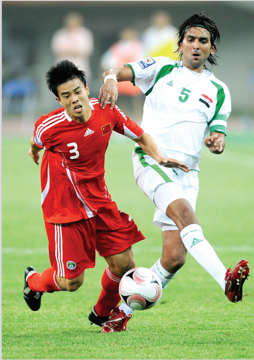
منتخبنا الوطني بانتظار نتائج مفاوضات اتحاد الكرة مع البرازيلي فييرا

للتجديد بالمبلغ نفسه لكننا بصراحة اوضحنا له عدم موافقتنا على طلبه وبالامكان الجلوس على طاولة المفاوضات اليلغ ونحن من جهتنا سنوفر له جميع مستلزمات النجاح في مهمته مثلما احطناه بالرعاية والاهتمام قبل واثناء نهائيات امم اسيا وتمكن من تحقيق عنصر الانسجام بين اللاعبين والسير بخطى ثابتة نحو اللقب الاسوي الذي خلد اسمه في تاريخ الكرة العراقية . وبشان الانتقادات التي يواجهها عبر وسائل الاعلام المقروءة على وجه الخصوص قال: مازلت ارى نصف الكاس مملوءة وليست فارغة وهناك ارقام مميزة تستحق منا كل التقدير برغم قساوتها في النقد الايجابي عملنا وهؤلاء الصحفيون النجباء هم مصايحنا التي لا نستغني عنها للاستدلال على صواب الطريق في الظروف الصعبة اما في شهر قلمه في وجعنا ولا يكتب الا بدافع الحقد والضغينة فاعتقد ان المتابع المنصف يفضح ذلك قبل ان نقرأ نحن ، ولدينا أمل كبير بان علاقة اتحاد الكرة والاعلام الرياضي لا تشوبها المقاطعات اوالمواقف الشخصية لان غايتنا جميعا هي خدمة كرة القدم العراقية ومن رام التعرض لشخص او بطولة القارات في جنوب حق فانه يسيء لكرتنا . ومع ذلك فننتوسم خيرا بجميع العاملين في الصحافة الرياضية وبقية القنوات الإعلامية المحلية.