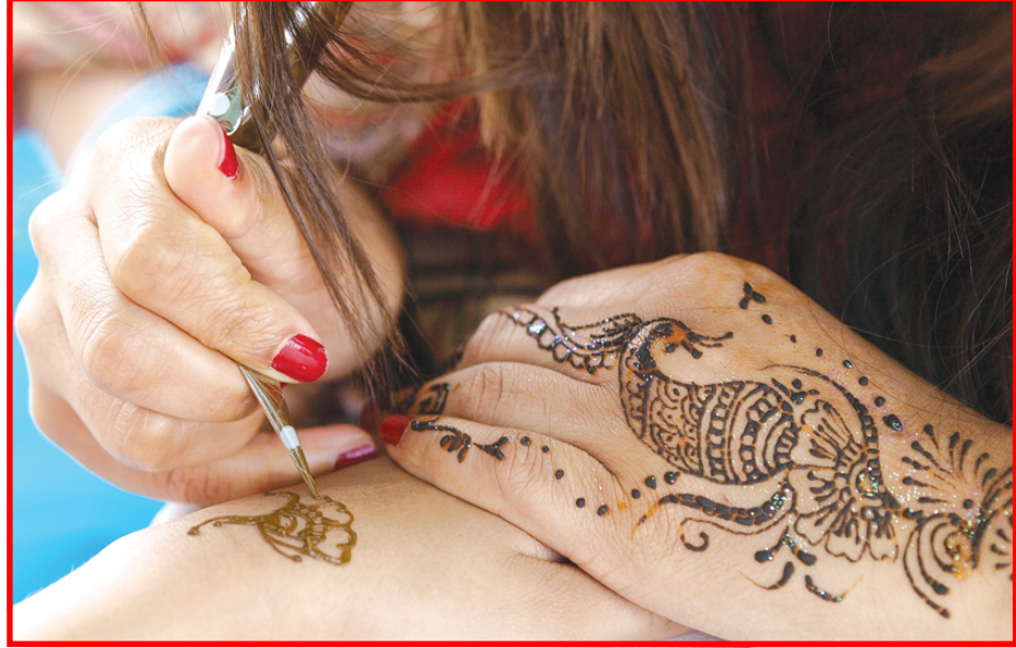
نقوش الحناء وصلت الحيا بريطانيا خلال احد المهرجانات الهندية التي تقام خارج الهند