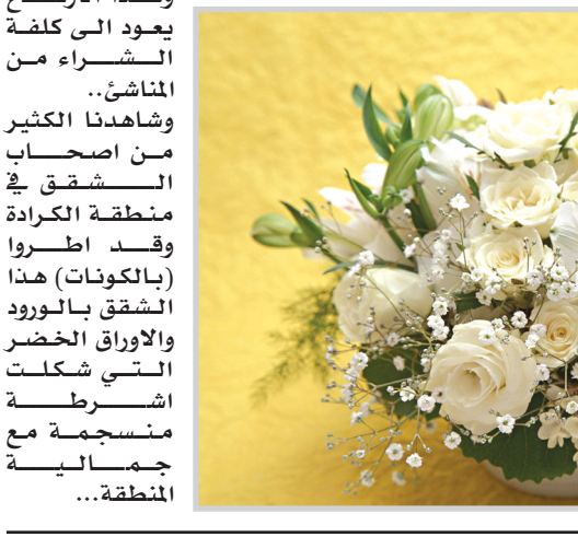
هذا الارتفاع يعود الى كلفة الشراء من الماشق.. وشاهدنا الكثير من اصحاب الماشق في منطقة الكرادة وقدم اطروا (بالكوتات) هذا الشق بالورد والاوراق الخضرة التي شكلت اشرفة منسجمة مع جمالية المنطقة...