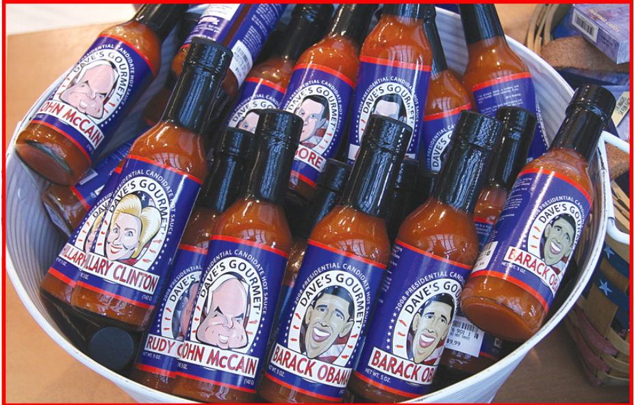
مجموعة من قنانيها (الصلصة الحارة) وهي تحمل صور مرشحي الرئاسة الأمريكية