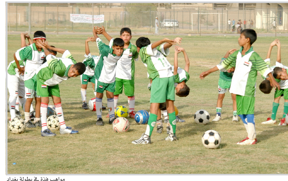
مواهب فذة في بطولة بغداد

والتاج ومدرسة السلام والأكاديمية وهيئة تطوير (أ و ب) والسلام والحرية قسمت الفرق على مجموعتين ضمت كل مجموعة ٧ فرق تنافست بطريقة