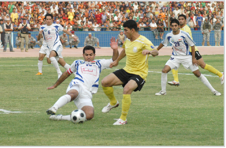
نهاية طيبة لاطول دوري