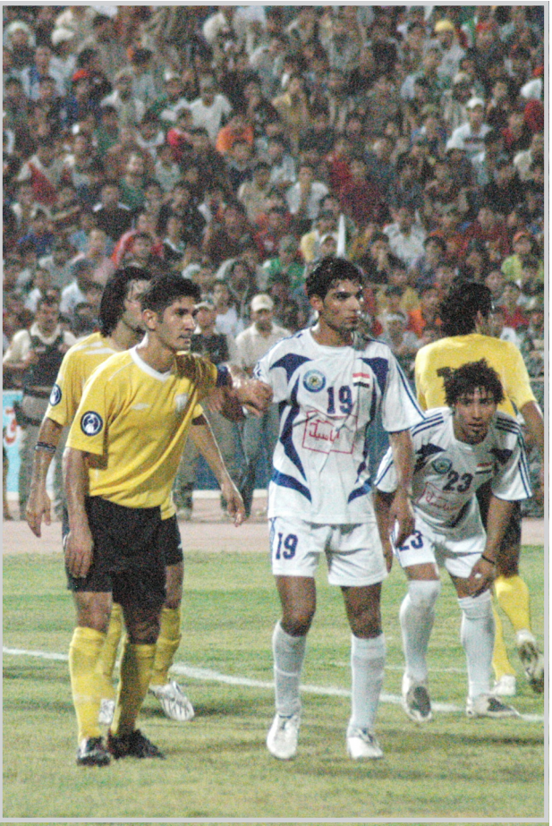
الجمهور يتوجع في مباراة الختام

إن كرة القدم اصبحت تشكل الحياة بالنسبة لعدد غير قليل من العراقيين فلا تقتلوا الحياة باهمالكم لكرة القدم، بل يجب ان تدعم بكل السبل الممكنة.