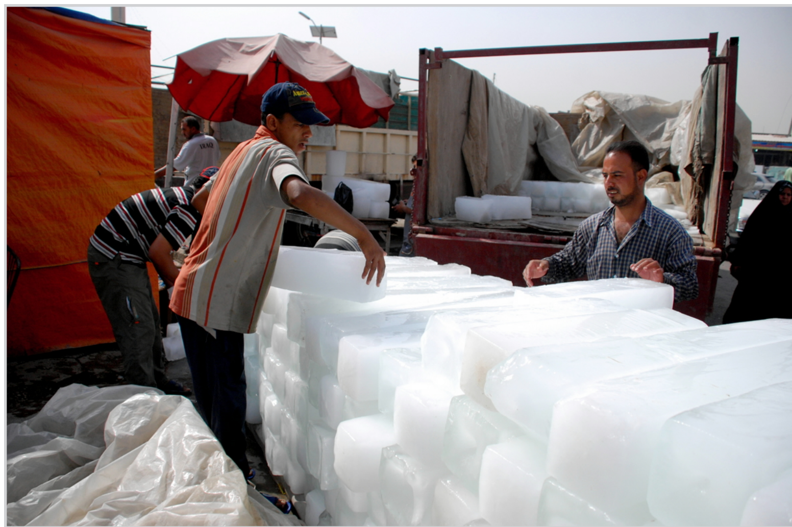
بورصة النجف...

بغداد/ عليا القيسي أعلنت الشركة العامة لصناعة الزيوت النباتية انه من المتوقع ان تبلغ نسبة إنجاز مشروع تأهيل الخطوط القائمة لصناعة الصابون والدهون والمنظفات ٩٠٪ نهاية العام الحالي بعد ان كانت نسبة الانجاز خلال العام الماضي ٨٠٪ فقط. وقال مصدر مسؤول في قطاع الصناعات الغذائية والدوائية للمكتب الإعلامي في الوزارة في بيان تلقت المدى نسخة منه امس ان الشركة طالبت بزيادة كلفة المشروع الى (٢٧) مليار دينار بعد ان كان مخصصا له (١٥,٩٦٦) مليار دينار وذلك لماكبة التطور الحاصل في الماكائن والمعدات فضلا عن الزيادة الحاصلة في اسعارها. وفي سياق ذي صلة اوضح المصدر ان الشركة