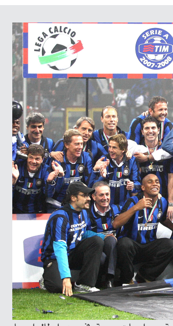
انتر ميلان يترقب مواجهات صعبة في دوري ابطال أوروبا