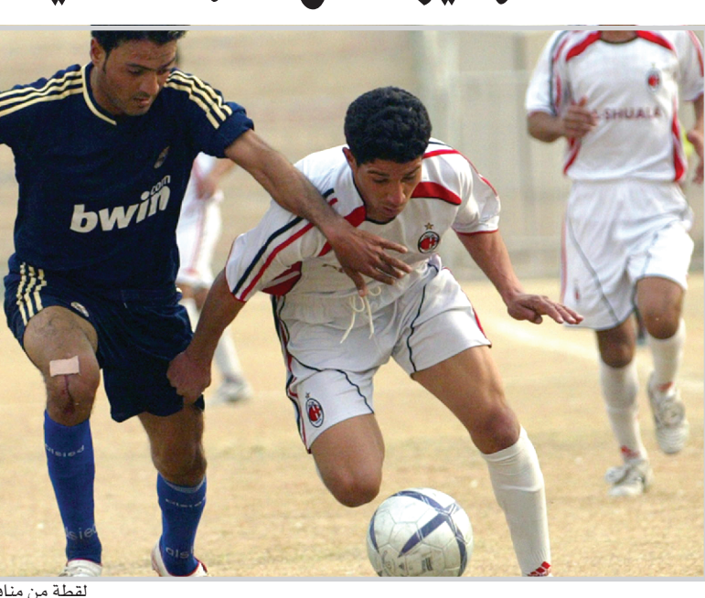
لقطة من منافسات الشباب في بطولة سابقة

للاتحاد في حديثه للمدى: ان دوري الشباب للموسم المقبل سيكون مصاحباً لمباريات الدوري الممتاز من اجل إعطاء الشباب الأهمية التي يستحقونها من خلال التشجيع وتسهيل الاضواء على المباريات وتوعيمهم على اجواء اللقاءات بحضور الجماهير فضلاً عن ان اللعب امام دوري الكبار سيسهم في اندفاع الشباب الى تقديم افضل ما لديهم من الامكانيات الفنية اضافة الى ان المدربين سيكونون على المحك وجميع هذه المؤشرات تصب في مستقبل اللعبة. واضاف : ان المشاركة للموسم المقبل اختيارية على ان تكون إجبارية في المواسم المقبلة في مسعى من اتحاد الكرة الى توسيع القاعدة الكروية وعودة بطولات الفئات العمرية وتفجيلها في اجندته بعد غياب طويل بسبب الظروف الصعبة.