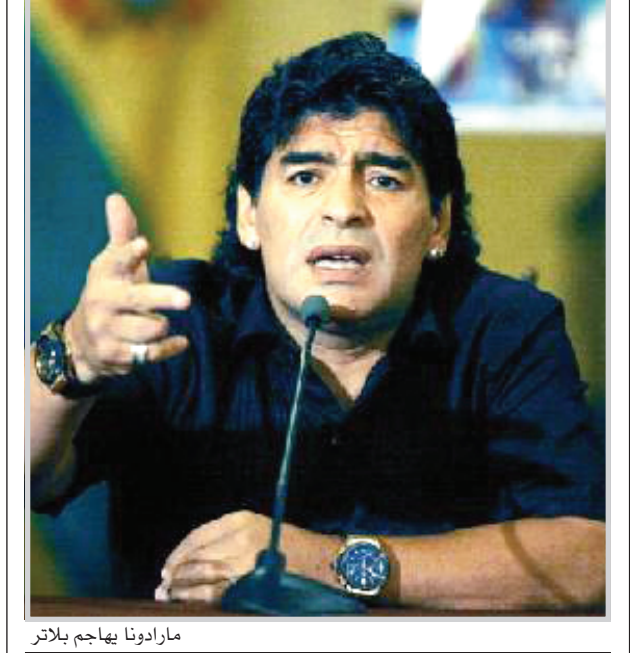
مارادونا يهاجم بلاتر

نيقوسيا / ا ف ه ب وصف الاسطورة الارجنتيني ديجو ارماندو مارادونا، رئيس الاتحاد الدولي لكرة القدم فيفا السويسري جوزف بلاتر بأنه عبد لاعبي الكرة في العالم. ورد مارادونا على ملاحظة بلاتر بان اللاعبين تحولوا في العصر الحديث عبداً بانه هو نفسه عبد، قائلاً: هو (بلاتر) في اندفاع الشباب الى تقديم افضل ما لديهم من الامكانيات الفنية اضافة الى ان المدربين سيكونون على المحك وجميع هذه المؤشرات تصب في مستقبل اللعبة. واضاف : ان المشاركة للموسم المقبل اختيارية على ان تكون إجبارية في المواسم المقبلة في مسعى من اتحاد الكرة الى توسيع القاعدة الكروية وعودة بطولات الفئات العمرية وتفجيلها في اجندته بعد غياب طويل بسبب الظروف الصعبة.