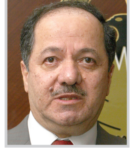
على الصعد كافة كما جرى تبادل الآراء

استقبال رئيس اقليم كردستان مسعود بارزاني سفير روسيا الاتحادية في العراق فاديمير جاموف بمناسبة إنتهاء مهام عمله.