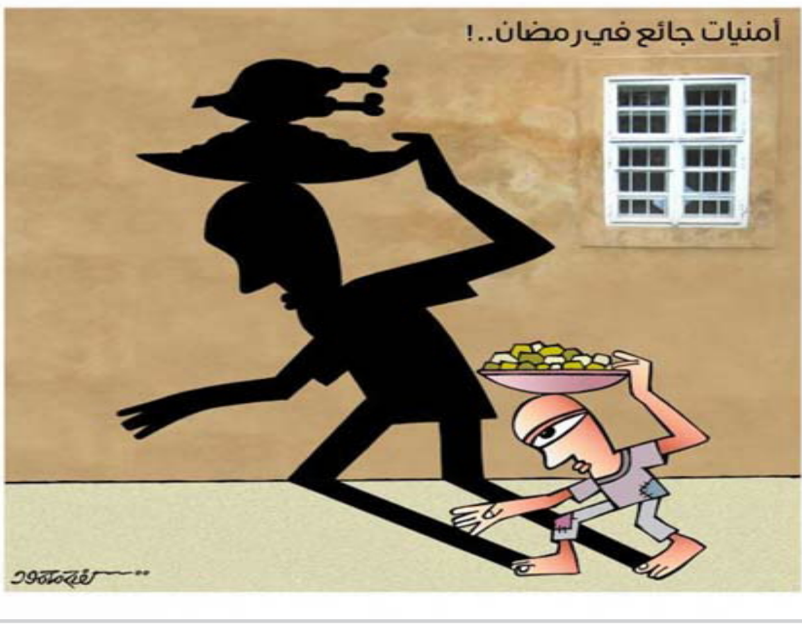
عن صحيفة اوان الكويتية

ويصن اتفاق الدوحة، الذي بموجبه انتهت ازمة سياسية عمرها عام ونصف وانتخب رئيس للبلاد وتشكلت حكومة وحدة وطنية، على "اطلاق الحوار حول تعزيز سلطات الدولة اللبنانية على كافة اراضيها وعلاقتها مع مختلف التنظيمات على الساحة اللبنانية بما يضمن امن الدولة والمواطنين" اي الاستراتيجية الدفاعية البند الوحيد الذي لم يبت في الحوار السابق.