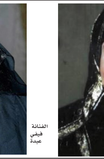
الفنانة فيفي عبدة