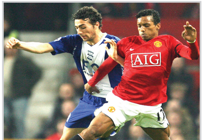
الشياطين الحمر قلعة ليفربول وتوسع لوهزيمة تشيلسي