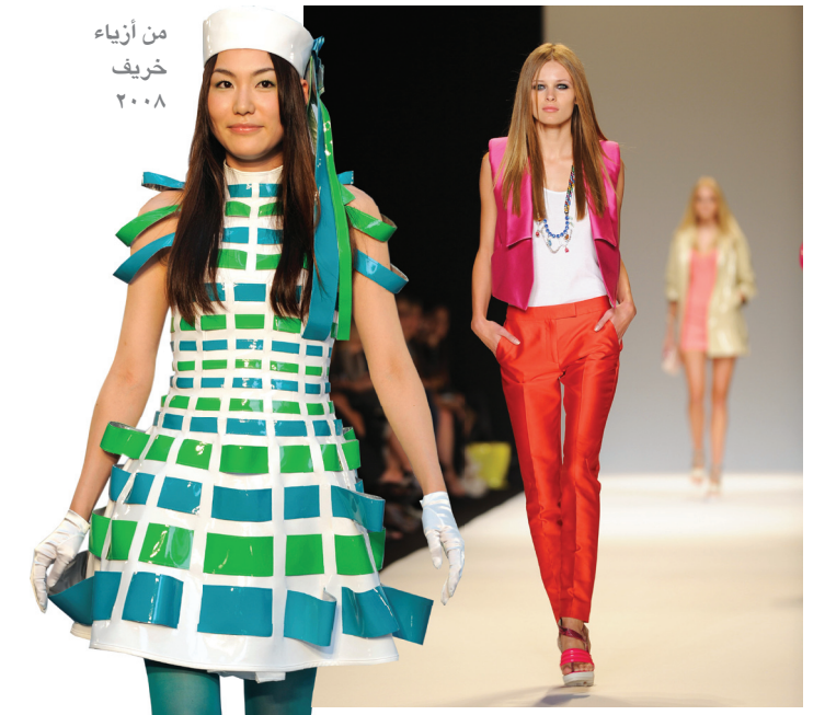
من ازياء خريف ٢٠٠٨