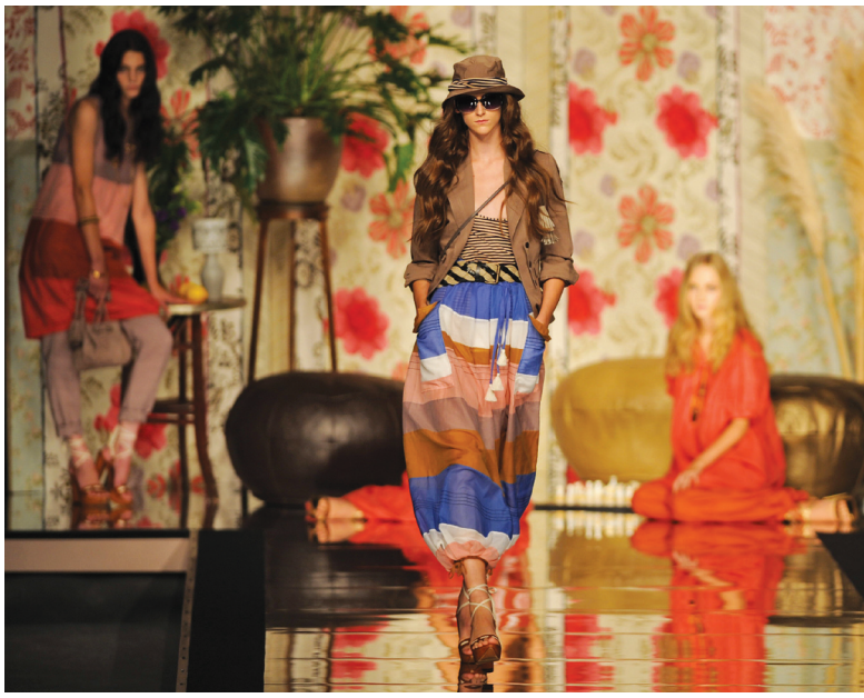
من اسبوع الازياء في مدريد