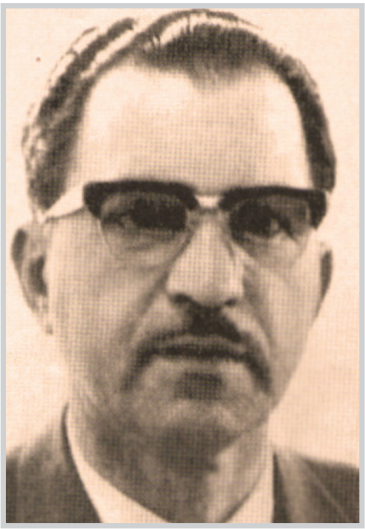
عبد الرحمن البزاز

بين الرجلين، حتى قام البزاز بتقديم استقالته في ٧ آب ١٩٦٦. كان البزاز (قومياً محافظاً) فحاول اضافة الطابع الليبرالي على الحكم في العراق وتسريع الخطوات من أجل الدخول إلى الحياة الليبرالية، لكن طموحاته تبدت بتغيير النظام بعد موت عبدالسلام محمد عارف وأصطدامه بمقاومة كتلة الضباط التي أقصته في ظل حكم عبدالرحمن محمد عارف. ويعمل بعض المحللين استياء العسكر من البزاز بأنهم (قد استاءوا ومنذ البداية من وجوده على رأس مجلس الوزراء وليس فقط لأنه كان مدنياً، بل أيضاً لأنه كان شديد الاستقلالية وكثير البراعة بالنسبة اليهم والى نوقهم). في تشرين الأول ١٩٦٩ تم اعتقاله وسجن بتهمة العمالة