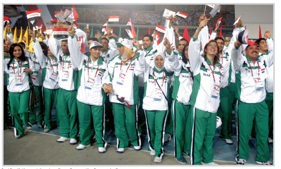
الرياضيون العراقيون يتطلعون الى حل توفيقي بين اقطاب الازمة

عجلة الحوار وبشأن امكانية تعديل او الغاء بعض ما جاء في القرار ١٨٤ بما يتناسب مع الظروف الراهن ويخدم مصلحة رياضتنا البالطة عن طوق النجاة من اهلها وليس من الخارج قال: - اعتقد ان القرار أفرغ من محتواه تدريجيا في عدة مراحل انتجت بتشكيل هيئة مساندة منتخبة من الاتحادات تدبر امور الرياضة الى جانب الهيئة المؤقتة المنبثقة من القرار