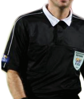
الحكم المساعد الدولي لوي صبحي يتابع لعبة جديدة

بغداد / المدى وعضوية حسين سعيد رئيس الاتحاد العراقي لكرة القدم مع جوزيف بلاتر رئيس الاتحاد الدولي لكرة القدم (فيفا) والذي سيتم فيه مناقشة موقف الاتحاد من الانتخابات. و اشار مسعود الى ان الاتحاد بانتظار التعليمات التي ستتمخض عن اجتماع زيورخج وانه مع اجراء الانتخابات الديمقراطيةية للاتحاد ولن يعارضها او يقف ضد اجرائها بصيغتها القانونية والرسمية.