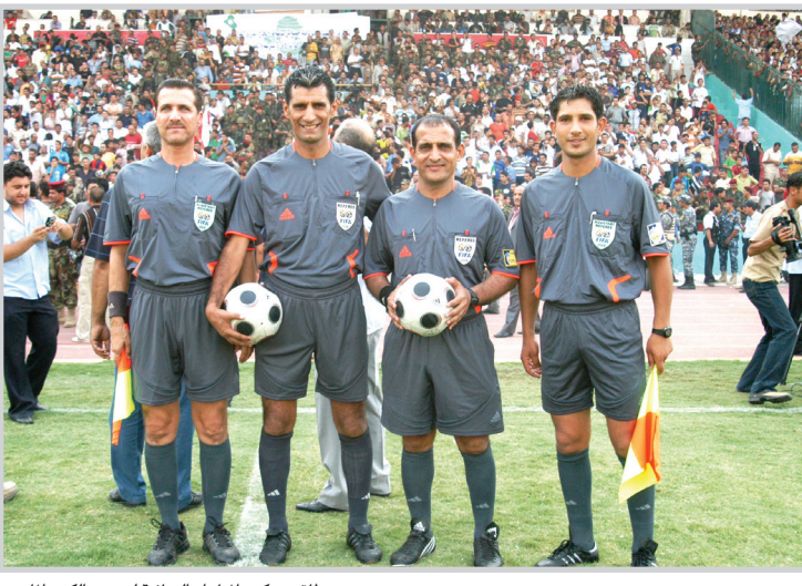
طاقم تحكيم المباراة النهائية لدوري الكرة الماضي

قدرة العراقي على رسم البسملة والتالق في سوح الرياضة منحهم طاقة خفية لمواصلة