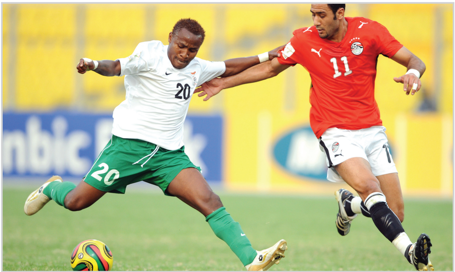
مصر تتأهل الى الجولة الأخيرة من التصفيات الموندالية

جرت ضمن تصفيات المجموعة الأوروبية الرابعة المؤهلة لنهائيات مونديال أفريقيا الجنوبية عام ٢٠١٠ والتي تابع دقائقها التسعين أكثر من سبعين الف متفرج اكتظت بهم مدرجات ملعب مدينة نورموند، وقدم المنتخب الألماني عرضاً كبيراً في الشوط الأول من المباراة ولعب كرة حديدية بكل ما تعنيه الكلمة من معنى، وأشارت الصحافة الألمانية الى ان المستوى المتقدم الذي قدمه لاعبو المنتخب الألماني لم تشهده اغلب مباريات المنتخب السابقة، ولم يعض زمن طويل على احداث الشوط الأول ليقتدم المنتخب الألماني بهدف احرزه بمجهود فردي اللاعب لوكاس بودولسكي مؤكداً من خلاله على انه لاعب وهدف كبير وأرسل به رسالة واضحة للعالم الى رئيس مجلس ادارة بايرن ميونخ كارل هابنز وميونيخية ومدير النادي اولي هونيس، اللذان وجها له انتقادات لاذعة قبل الابعاد كاد يودي بالهمة امام المنتخب الروسي، ويعد هدف بودولسكي اضاف قائد المنتخب مايكل بالاك الهدف الثاني، الذي كان بمثابة رد على مدير المنتخب اوليفر بيرهوف، الذي كان على خلاف كبير مع هذا اللاعب كاد يودي بالهمة امام المنتخب الروسي، ويعد هدف بودولسكي اضاف قائد المنتخب مايكل بالاك الهدف الثاني، الذي كان بمثابة رد على مدير المنتخب اوليفر بيرهوف، الذي كان على خلاف كبير مع هذا اللاعب كاد يودي بالهمة امام المنتخب الروسي، ويعد هدف بودولسكي اضاف قائد