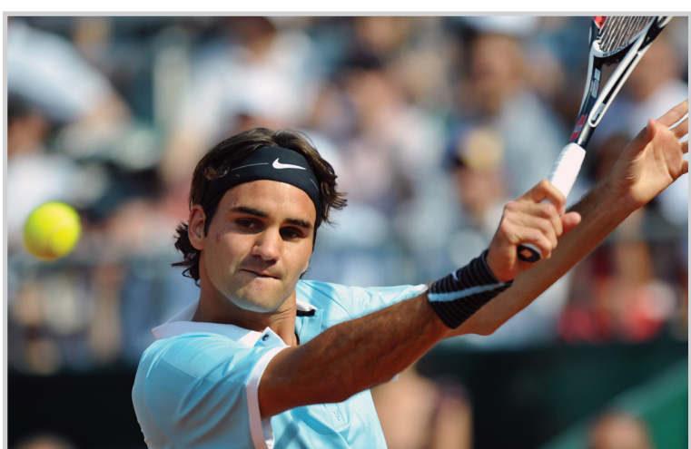
فيدرر بعد بستوري أفضل في بطولة مدريد

ميدوز على البلجيكي ستيف داركيس ١/٦ و ٤/٦. أما الإيطالي سيموني بوليلي، الذي شارك في البطولة بدلا من الروسي مارات سافين المصاب في الكتف، فقد فاز على الاسباني نيكولاس ألامارو ٦/٧ (٤/٦) و ١/٦ و ٦/٧ (٧/٩) بعدما تغلب عليه ١/٤ و ١/٦ و ٦/٧ (٧/٩) اليوم الإثنين كما تغلب الأمريكي ماردي فيش الذي يشارك في البطولة الأولى له بعد فلاشينج