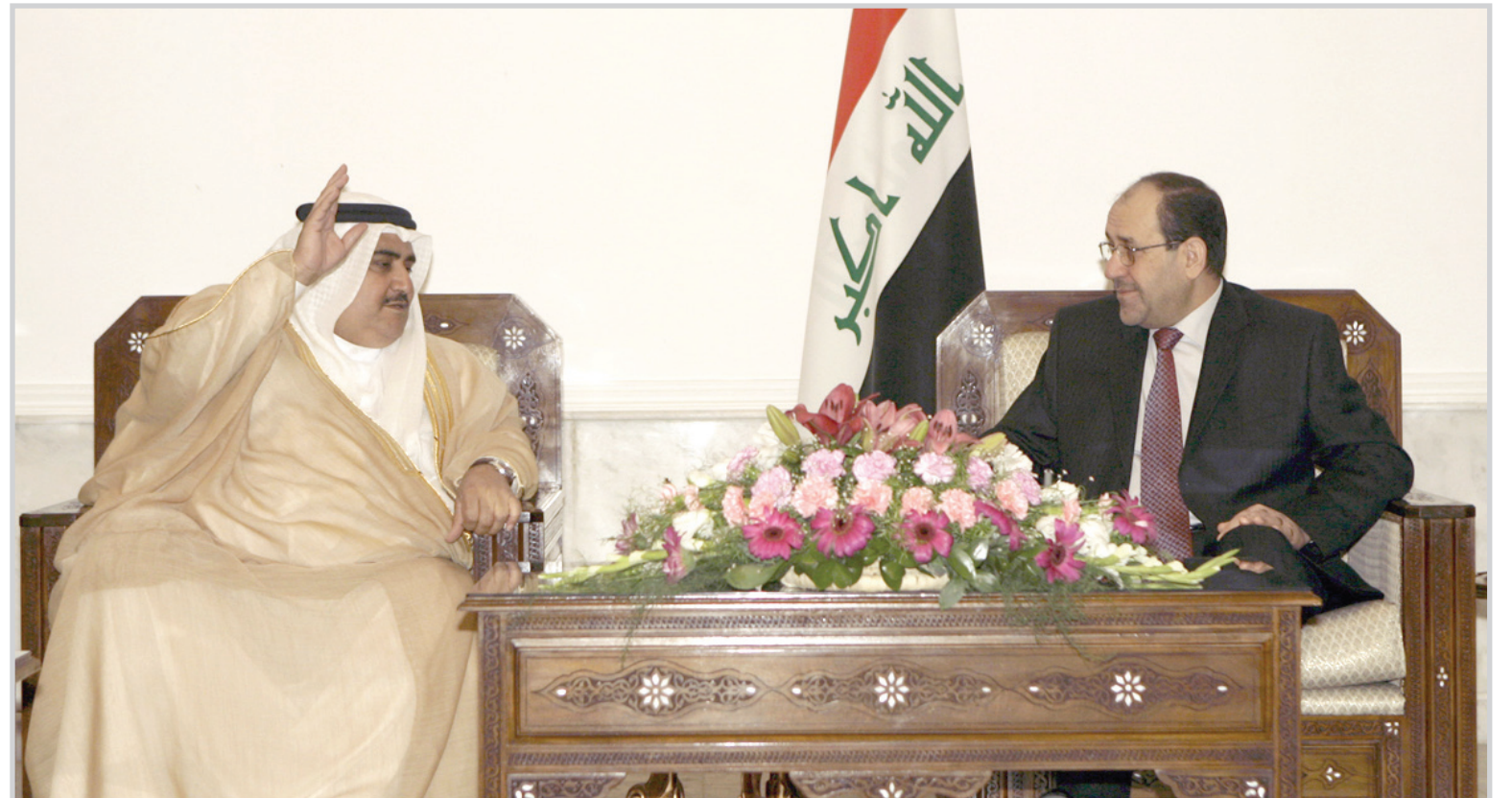
نوري المالكي مع خالد بن حمد ال خليفة

البصرة/ المدى اعلن مصدر امني السبت ان قوات الامن اعتقلت كويتيا في منفذ صفوان الحدودي بين العراق والكويت بتهمة التخطيط لشن هجمات ارهابية في البلاد. وقال مصدر في قيادة عمليات شرطة البصرة لغرانس برس ان "قوات الحدود اعتقلت كويتيا في منفذ صفوان الحدودي، اعترف بعد التحقيق انه دخل العراق لتنفيذ اعمال ارهابية في محافظة النجف او كربلاء". و اضاف رافضا الكشف عن اسم الكويتي ان الاخير "يعمل كمساعد مهندس في الادارة العامة للمرور في دولة الكويت".