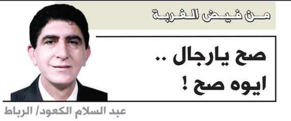
صح صحیح للشريعة