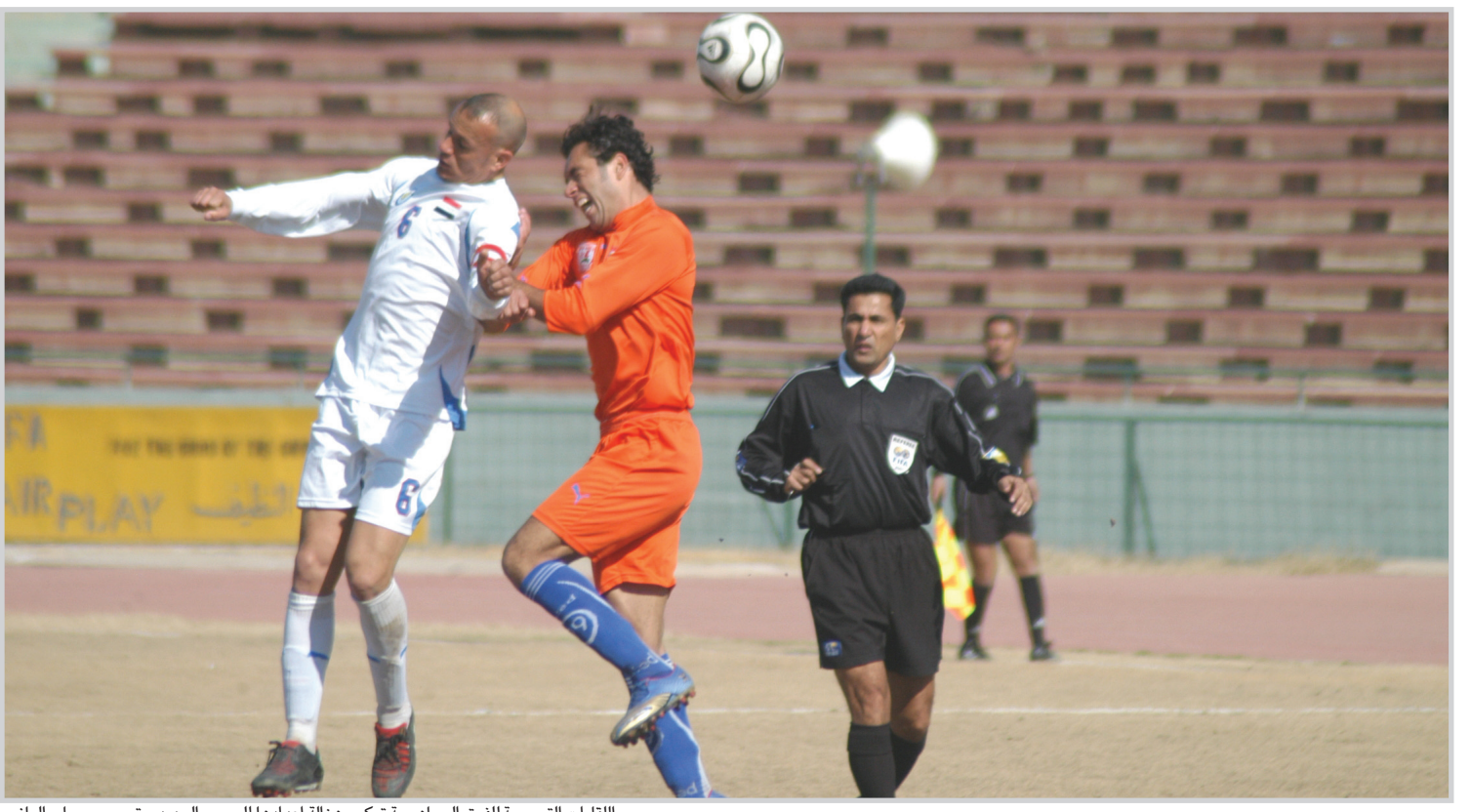
اللقاءات التجريبية للفرق الجماهيرية تعكس مزاجاً اعدادها للموسم الجديد..