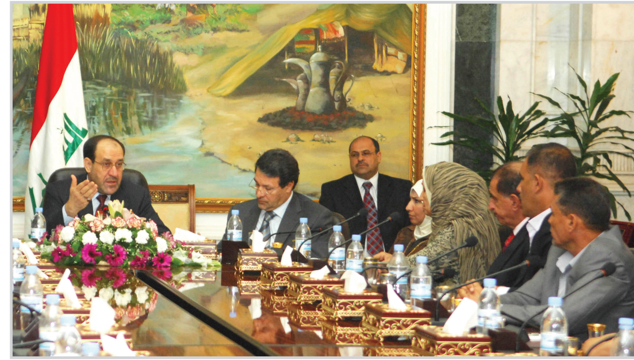
رئيس الوزراء نوري المالكي أثناء حديثه لخبيرة من الأكاديميين والرياضيين والإعلاميين

تعيين الكفوئين والمخ فاروق جنجون الى ان الوضع الحالي الذي تعيشه الرياضة العراقية في ظل تحضيرها لإجراء انتخابات الاتحادات المركزية ، يؤدي الى استنزاف الجهود والأفكار وعدم الوصول الى ضفة الاستقرار ما لم يلجأ القائلون على الانتخابات الى مسألة التعيين داخل مجالس ادارات الاتحادات ، واستثمار الكفاءة لخدمة مصلحة الرياضة أياً كان شكل اللعبة سواء كرة القدم ام الملاكمة ام المصارعة وغيرها .