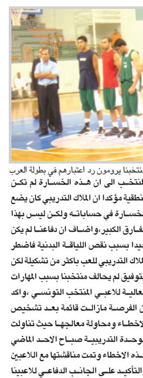
لاعبو كرة سلة منتخبنا يرونهم رد اعتبارهم في بطولة العرب

المشاور وينجاح في هذه البطولة. وأسرفت نتائج مباريات المجموعة الثانية عن فوز منتخب تونس على نظيره السعودي ٨١-٥٢ والجزائر على ليبيا ٨٢-٦٨ في المباراة التي شارك بدارتها حكماً الدولي مروان ماجد حميد كما فازت السعودية على الجزائر ٦٣-٦١. فيما تقام اليوم ايضا مباريات ضمن المجموعة الاولى تجمع بين السودان ومصر والاردن امام العرب.