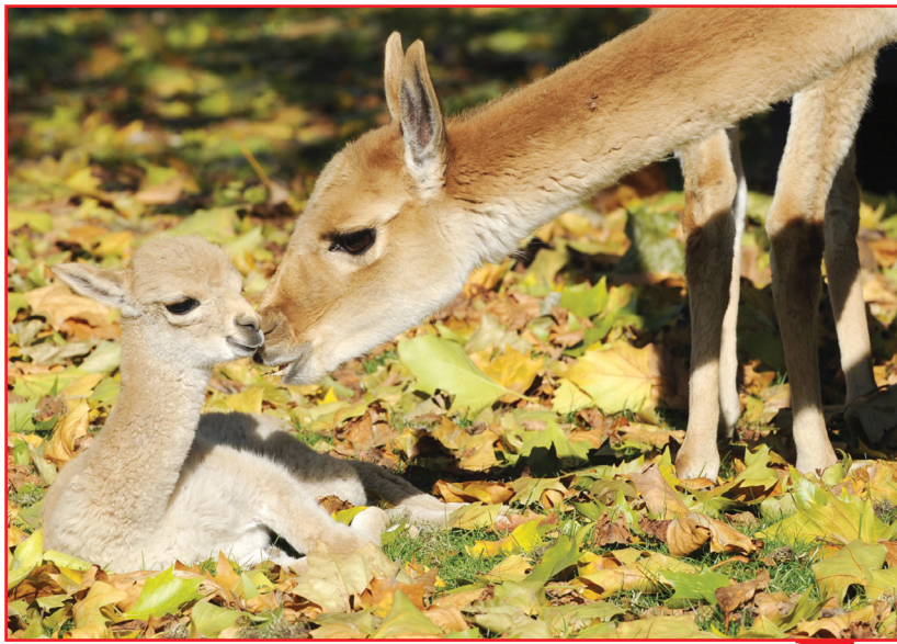
أحد أنواع الغزال النادر الذي يعيش في جبال الانديز تمت ولادة الحيوان الاول من نوعه في حديقة حيوانات مدينة برلين الالمانية

قوالب طينية لمرشحي الرئاسة الأميركية مصنوعة في لندن تحضيراً لعمل مجسم كامل من الشمع للرئيس المنتخب يوضع في أحد متاحف العاصمة المخصصة لتمثيل الرؤساء