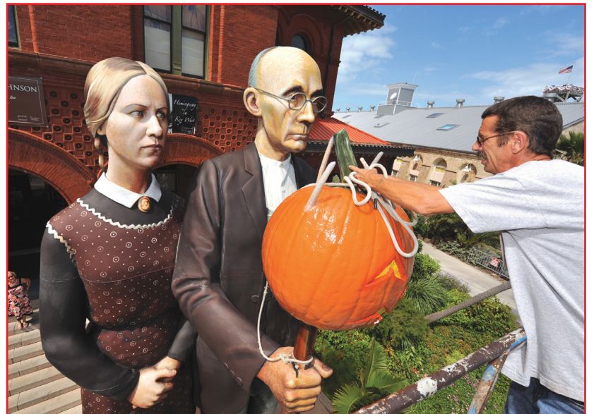
منحوتات وضعت خارج المتحف الغربي الرئيسي للفن والتاريخ في فلوريدا