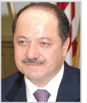
اربييل / PUKmedia نفي الدكتور فؤاد حسين رئيس ديوان رئاسة الاقليم كردستان في تصريح صحفي الاخبار التي تناقلتها منذ

فترة الصحف ووسائل الاعلام المحلية والخارجية زعمت فيها قرب قيام مسعود بارزاني رئيس الاقليم بزيارة تركيا في هذه الفترة بناء على دعوة رسمية. وقال نعلن من جانبنا ان برنامج مسعود بارزاني لا يتضمن زيارة تركيا في الوقت الراهن، وهذا لا يعني سد باب الحوار والصدقة مع اي طرف. ونوه بان هذا الخبر نشر على لسان رئيس ديوان رئاسة الاقليم كردستان، ونحن بدورنا نؤكد اننا كديوان رئاسة الاقليم لم نبدل بأي تصريح من هذا القبيل لأي شخص أو طرف كان.