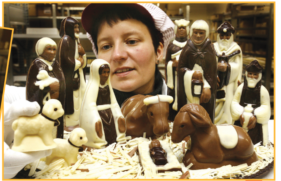
مجموعة من اللقطات لأحد محال الحلويات في ألمانيا حيث يتم استهلاك 400-500 كغم يوميا لصنع قوالب الشيكولاته تحضيراً لأعياد الميلاد