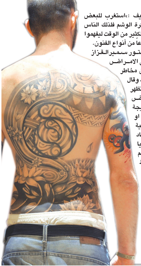
المبعض . ويضيف : «استغرب للبعض الذي يرفض فكرة الوشم فلذلك الناس يحتاجون إلى الكثير من الوقت ليفهموا بأنه ليس إلا نوعاً من أنواع الفنون. ويحذر الدكتور سمير القزاز اختصاصي الأمراض الجلدية من مخاطر الوشم مستقبلاً، وقال للمدى قد تظهر لبعض الأمراض الانتقالية نتيجة استخدام الأبرة أو الماكنة الكهربائية في اجساد مختلفة، داعياً من يقوم بالرسم باتباع الشروط الصحية مثل غرس الابرس المستخدمة في الحبر ذاته مرات عدة ما يؤدي الى امكانية نقل هذه الامراض.