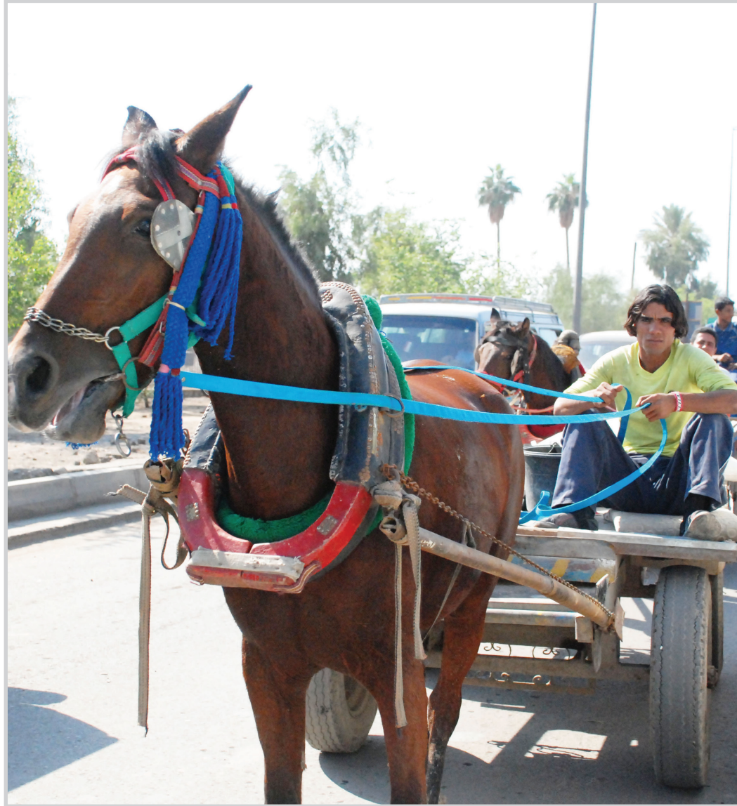
عربات الحيوانات تعيق حركة السير في شوارع بغداد ... عسدة سعد الله الخالدي

بغداد/احياء الموسوي احالت وزارة الاعمار والإسكان عدة مشاريع لصيانة الطرق في محافظتي بغداد وكربلاء ضمن جهود الوزارة للنهوض بقطاع الطرق والجسور وتطويره. اعلن نك مصدر مسؤول في