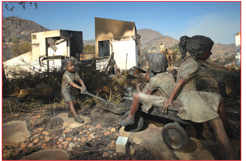
معرض من الاعمال البرونزية وبالجم الطبيعي للفنان جين ديكر.. والمعرض مقام على قارعة الطريق في مدينة مونتيستيو الاميريكية