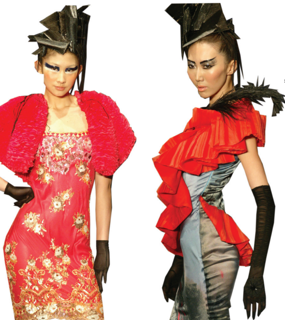
لقطات من اسبوع الازياء الصيني