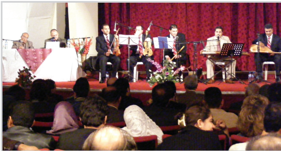
المبدع صالح الكويتي مثل (هذا مو (وتانيني) و(كلبك صخر جلمود) وأغنية (الراح) وغيرها من إبداعات (إنصاف منك) و(وين رايح وين) يقول الفنان نجاح عبد الغفور: إن

أقامت دائرة الفنون الموسيقية التابعة لوزارة الثقافة - المركز الدولي لدراسات الموسيقى التقليدية ندوة ثقافية وموسيقية قدمها الباحث د.مهيمن الجزراوي بعنوان (صالح الكويتي وملامح الأغنية العراقية) تناول حياة الملحن العراقي الكبير صالح الكويتي الذي ولد عام ١٩٠٥ من أصل عراقي وكيف بدأت مسيرته الفنية ببغداد حين باشتر تعلم الموسيقى مع شقيقه الملحن داود الكويتي ثم كيف كانت بداية رحلته في التلحين للمطربين العراقيين في بداية الثلاثينيات فغنت له سلمية مراد وعفيفة اسكندر وزكية جورج ومنيرة الهوزون وغيرهم. وأشار الباحث إلى أن الفنان المبدع صالح الكويتي هو أول من انحل