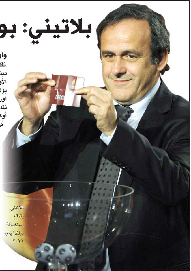
بلاتيني يتوقع استضافة بولندا يورو 2012

وارسو / د ب أ نقلت صحيفة بولندية عن الفرنسي ميشيل بلاتيني رئيس الاتحاد الأوروبي لكرة القدم تصريحه بأن بولندا قد تضيف بمفردها بطولة أوروبا المقبلة يورو 2012 إذا لم تتمكن شركتها في استضافة البطولة أوكرانيا من الانتهاء من استعداداتها في الوقت المناسب، وتعتبر هذه هي المرة الأولى التي يعترف فيها بلاتيني صراحة بإمكانية