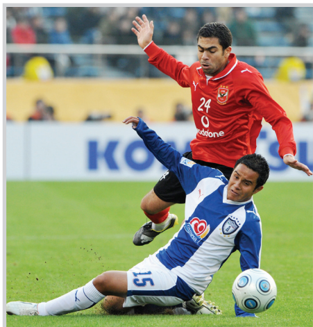
جانب من إحدى منافسات دوري المحترفين الآسيوي