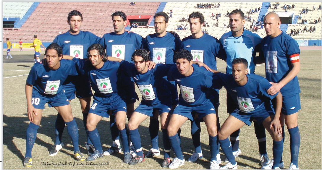
الطلبة يحتفظ بصدارة له الجنوبية مؤقتا

اسفرت مباريات افتتاح الدور السابع من المرحلة