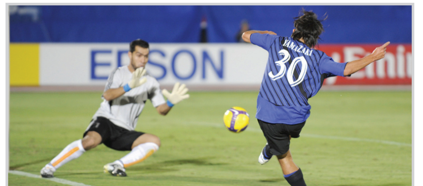
جانب من إحدى منافسات دوري المحترفين الآسيوي