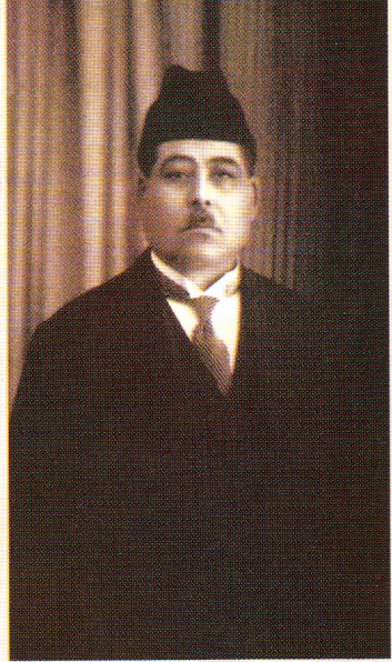
معروف عبد الغني الرصافي

هذه القصيدة للشاعر العراقي معروف الرصافي هي قصيدة قديمة ، وقبل نصف قرن تقريباً عادت لها مجلة الاثنين والدنيا فأعدت نشرها باعتبار انها تعبر عن واقع الحال يومذاك وهانحن نعيد نشرها اليوم وكلنا أمل ان لا يعود أحد لنشرها بعد نصف قرن تعبيراً عن واقع الحال!