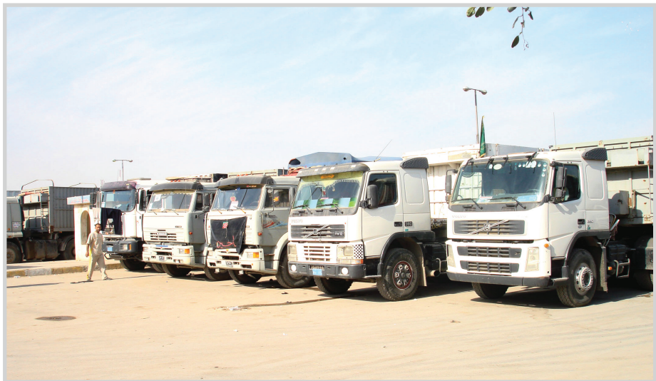
الشاحنات الثقيلة تمنع مرور السيارات في طريق الشوملي والمدحتية.

مشيراً الى ان العمل شهد توقف مرور السيارات بين الشوملي والمدحتية بعد ان غرزت اثنتان من الشاحنات الثقيلة وسط الشارع الترابي. وأكد المصدر ان الشاحنات التي تزيد حمولتها على ١٠ أطنان ستمنع من المرور في الشارع المذكور حيث سيجري تحويل مسار الشاحنات القادمة من محافظة واسط الى طريق الصويرة، ثم جبلة ثم الحلة فيما سيتم تحويل مسار الشاحنات القادمة من محافظة الديوانية الى طريق القاسم ثم الى الحلة على ان يستمر العمل بذلك لحين اكتمال المشروع الذي تموله وزارة الإسكان والإعمار.