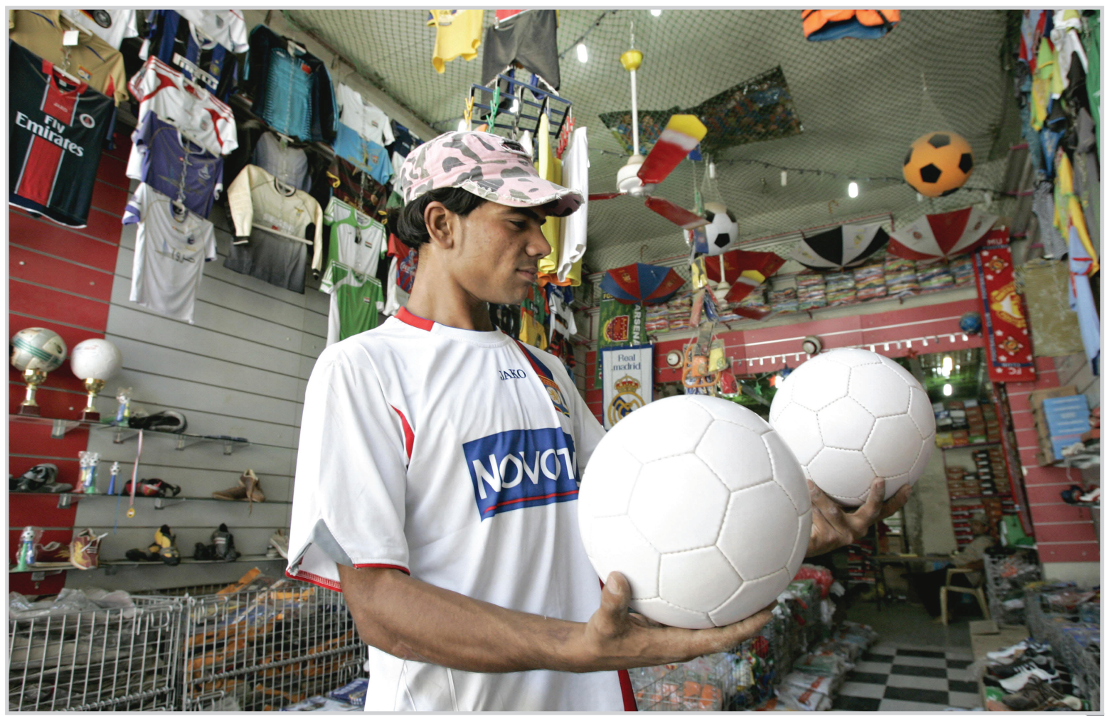
التجهيزات الرياضية تلاقي قبلاً من الشباب.. صورة من الأرشيف

أحالت وزارة الإعمار والإسكان عدداً من مشاريع الطرق والجسور الى التنفيذ في عدد من محافظات البلاد. أكد ذلك مصدر مسؤول في الوزارة، بحسب المركز الوطني للإعلام، وأضاف: أن المشاريع المحالة شملت مشروع المرحلة الثانية من مشروع جسر الكارضية في مدينة الكوت بكلفة (٧٩) مليار دينار، ومشروع (تثبيت أكتاف طريق موصل/بيجي/بغداد) بطول (٢٤,٥) كم، وبكلفة أكثر من مليار دينار، ومشروع الاعمال المتبقية من تحويلية الحمودية بطول (١٢,٥) كم، وبكلفة أكثر من (١٣) مليار دينار، إضافة الى مشروع صيانة المناطق المتضررة لطريق (تكريت/كربوك) البالغ طوله (٢٤) كم، وبكلفة أكثر من مليار دينار. وأفاد المصدر أيضاً عن إحالة مشروع طريق (كربلاء/رزاة/عين تمر) الى التنفيذ بكلفة أكثر من مليار دينار، ومشروع (المر الثاني لطريق بعقوبة/خالص) بطول (١١,٤) كم وبكلفة أكثر من (٨) مليارات دينار، كما تم إحالة طريق محمد السكران بمحافظة ديالى الى التنفيذ بطول (٥٥) كم وبكلفة (٤٥٩) مليون دينار. وأشار المصدر الى ان الوزارة مستمرة في مشاريع إنعاش طرق الاهور في البصرة، إذ أحالت مشروع الطريقي المؤدية الى محمية الصافية بقضاء القرنة بطول (٢٠) كم، وطريق الداخلية في قرية الشيليجية (٥) كم الى التنفيذ وبكلفة أكثر من (٣) مليارات دينار. مشروع مجمع سكني لتنفيذ في محافظة كربلاء بكلفة أكثر من (٥٢) مليار دينار، في خطوة تهدف الى التقليل من أزمة السكن بالمحافظة.