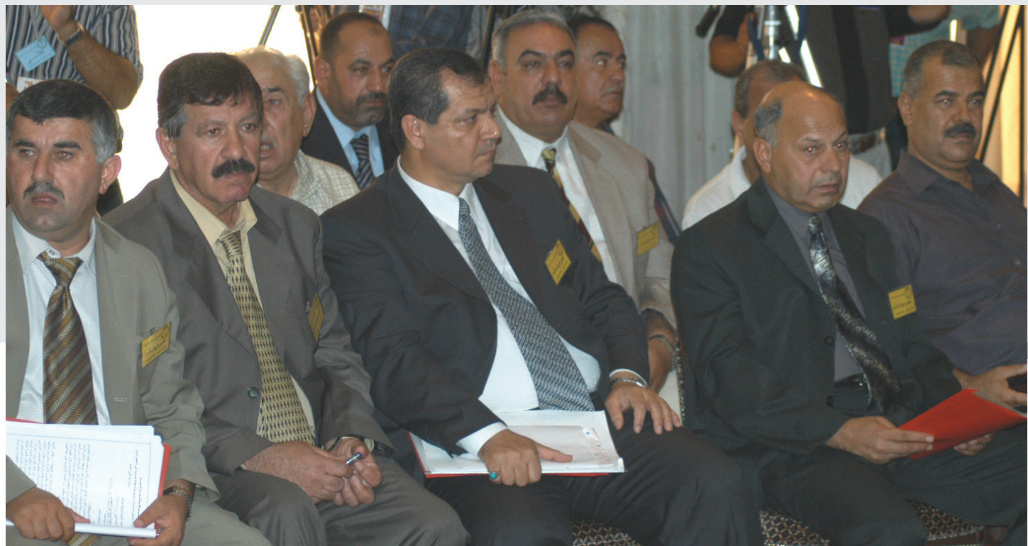
ادارة الاتحاد العراقي لكرة القدم