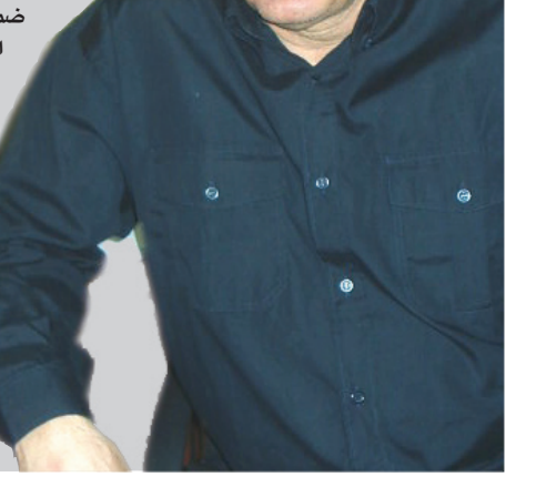
يونس محمود / أبرز اللاعبين عن لقاء نجوم اوروبا /