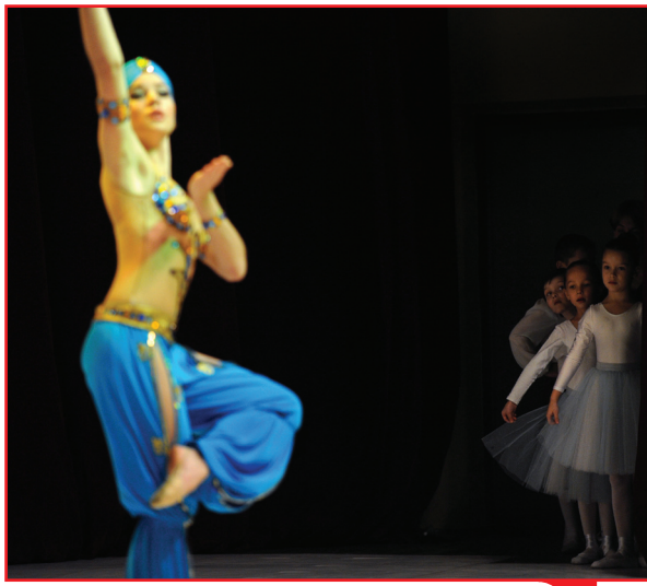
راقصو باليه من أكاديمية كيف للفنون يقدمون عرضاً راقصاً.. والأكاديمية تضم أكثر من 70 طفلاً موهوباً من عمر 6 - 16 سنة