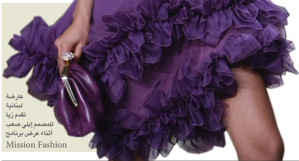
عارضة لبنانية تقدم زيا للمصمم إيلي صعب أثناء عرض برنامج Mission Fashion

قبل ايام اراد احد اصحاب العربات وهي مليئة بالضائع ان يدفعها، فكان صعبا عليه ذلك، فما كان من رجل المرور القريب الا انه مد يده وساعده في دفع عربته.