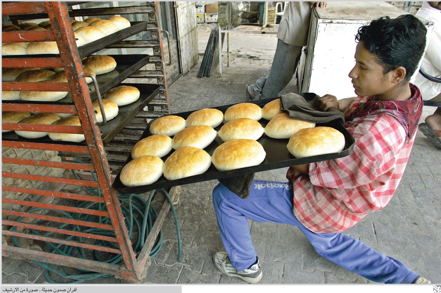
أفنان صمون حديثة.

بغداد / المدي اكدت وزارة النقل أن اختيار شركة كورنيل غروب الأمريكية المعنية بقطاع الموانئ يهدف الى تهيئة البيئات الاستثمارية الخاصة بتطوير ميناء أم قصر. وقال مصدر في الوزارة ان الوزارة انتهت من وضع شروط وقوانين سيتم من خلالها العمل لتنفيذ المشاريع الحالية، بعد ان تمت دراسة جميع العروض التي تقدمت بها الشركات العربية والاجنبية الخاصة بتأهيل الميناء الذي يعتمد عليه العراق في الحركة التجارية. واضاف ان الوزارة وجهت الجهات المختصة في الشركة العامة لمؤامني العراق بتطبيق نظام الصمة الذكية للسيطرة الالكترونية على الحضور والانصراف وهو جزء من خطة تطويرية بالاتفاق مع الشركة، موضحاً انه تم توجيه الجهات المختصة لشراء الأجهزة ونصبها ونوه المصدر الى أن ميناء أم قصر يعد من الموانئ الآمنة وأصبح محط أنظار الخطوط الملاحية الكبرى خاصة في مجال تنامي عمليات مسافة البضائع والحواليات.