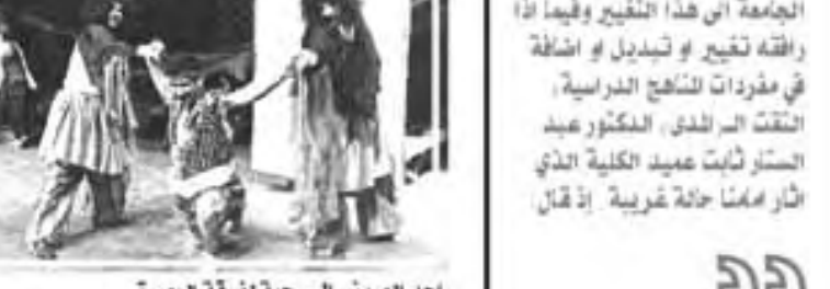
احد العروض المسرحية لفرفة البصرة

احد العروض الفنية التي سبق ونفذتها كلية الفنون الجميلة