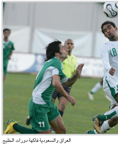
العراق والسعودية فأكبة دورات الخليج

الوطن بكأس البطولة، وجميع المنتخبات الخليجية لم تأت إلى السياحة إنما آتت لهدف واحد وهو تحقيق البطولة" واعترف بقوة مجموعة الأخضر في "خليجي ١٩"، وقال "المنتخب السعودي سيقابل منتخبات قوية مثل الإمارات الذي يريد المحافظة على اللقب وقطر الذي يعتبر من المنتخبات القوية وتريد إعادة أمجادها وتحقيق البطولة كذلك تطور المنتخب البيني . وشدد على أهمية "احترام الفريق المقابل مهما كانت قوته واحترام الخصم كما هو متعارف عليه يجعلنا