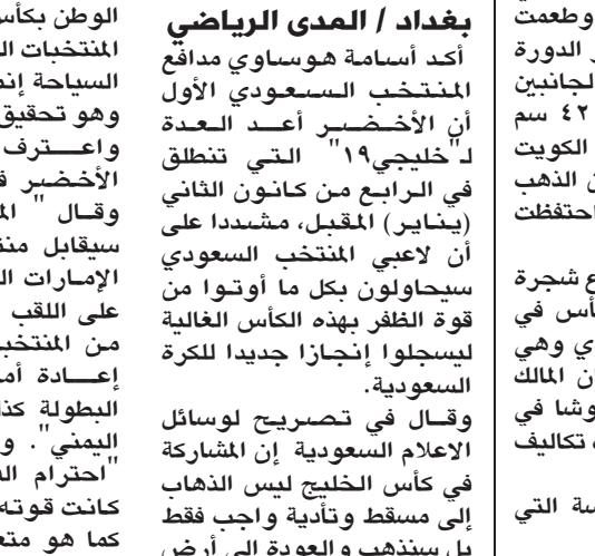
ماتشالا يحضر من العراق والكويت