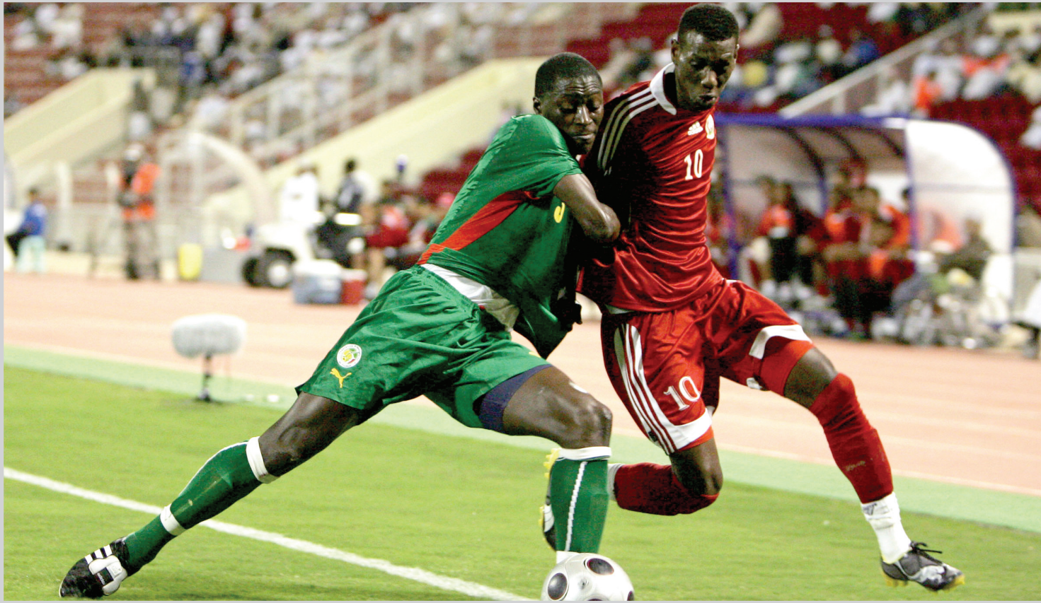
عمان سحقست السنغال في اخر تجاربها الاستعدادية لخليجي ١٩