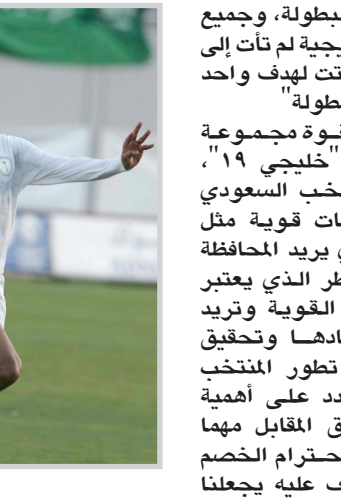
ماتشالا يحضر من العراق والكويت