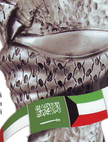
ماتشالا يحضر من العراق والكويت